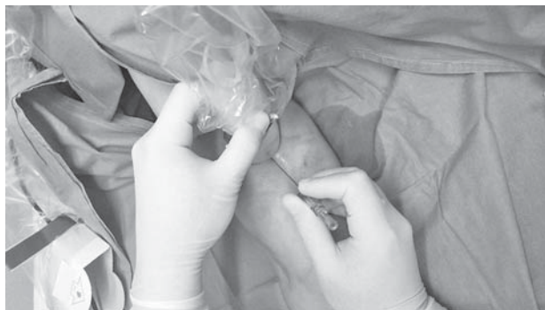
Slika 1. Punktiranje vene pod kontrolom ultrazvuka Figure 1. Ultrasound-guided vein puncture

Ukratko, najprije se uz pomoć UZ-a vizualizira prikladna vena na donjem dijelu nadlaktice (najčešće v. basilica ili v. cephalica). Potom se na mjestu pretpostavljene venepunkcije aseptički pripremi koža, uz upotrebu uobičajenih lokalnih dezinficijensa i prekrivanje sterilnim oblozima (kompresama). Ultrazvučnu sondu također treba prekriti sterilnom navlakom. Pod kontrolom UZ-a najprije se aplicira lokalni anestetik, a zatim se punktira vena Seldingerovom iglom čiji je vrh dobro vidljiv na UZ-u (slika 1.). Nakon što smo punktirali venu uvodimo vodilicu, u dužini od 30-ak cm, a zatim vadimo iglu vodeći računa da nam vodilica ostane u veni, a potom preko vodilice uvodimo split dilatator. Nakon