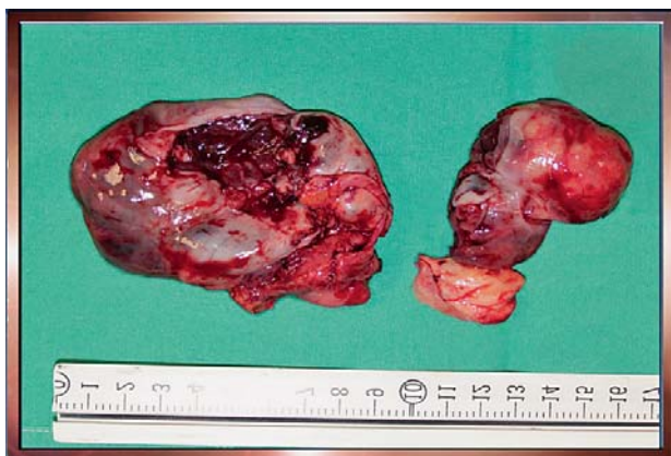
Slika 2. Resecirana slezena i desna adneksa Figure 2. Resected spleen and right adnexa