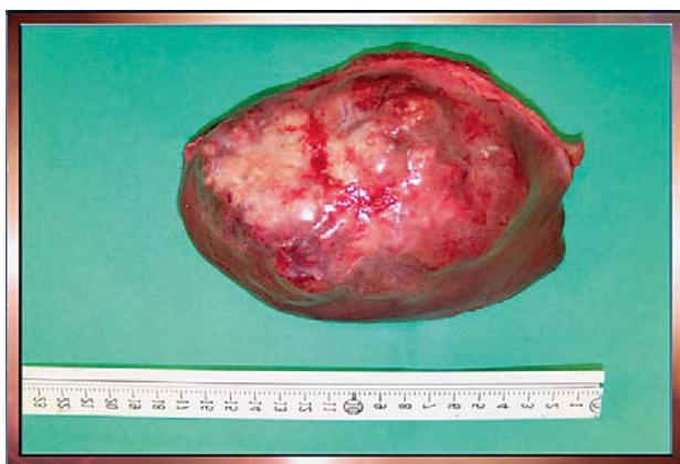
Slika 3. Resecirani 2. i 3. jetreni segment Figure 3. Resected liver segments II and III

preparata ponovo nije evidentirala presadne promjene unutar prvoga jetrenog segmenta (normalan jetreni parenhim uz nešto fibroze), dok je preparat 7. segmenta potvrđen kao presadnica. Postoperativni tijek ponovo je bio bez osobitosti te je bolesnica otpuštena 8. postoperativnog dana. Tijekom iduća 3 mjeseca praćenja bolesnica je bila bez evidentiranog recidiva bolesti te subjektivno bez tegoba. U tom je razdoblju primila 16 ciklusa kemoterapije (protokol FOLFIRI