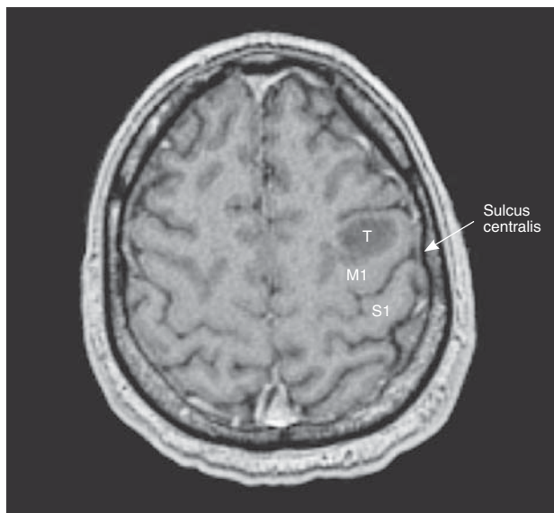
T – tumor; M1 – motorička regija/primary motor region; S1 – senzorna regija/primary sensor region

Slika 1. MR mozga. Aksijalna snimka u T1-vremenu nakon aplikacije kontrastnog sredstva. Vidljiva je tvorba veličine 18 \times 14 \times 16 mm, niskog intenziteta signala i bez patološke imbibicije. Strjelica pokazuje položaj centralne brazde (sulcus centralis)