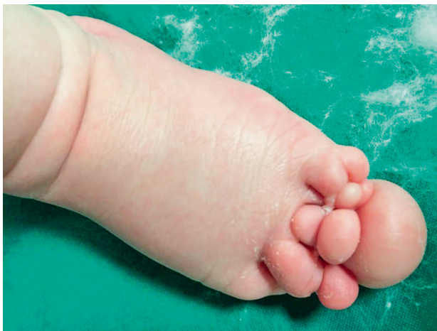
Slika 1b. Novorođenče u dobi od 12 dana, izgled lijevog stopala Figure 1b. Newborn - 12 days old. The appearance of the left foot

iz prve trudnoće zdrave majke koja je hospitalizirana u 19. tjednu trudnoće zbog povremenoga vaginalnog krvarenja. Trudnoća je redovito praćena, a ultrazvučna pretraga obavljena u 28. tjednu pokazala je povećanje desnog stopala fetusa. Nakon rođenja uočene su konstriksijska brazda iznad desnoga gležnja te lokalizirana kuglasta tvorba promjera 8 \times 8 cm. Stopalo nije bilo difuzno edematozno, a tvorba je pokrivala površinu dorzuma desnog stopala, dok prsti nisu bili otečeni (slika 1.a). Osim toga, novorođenče je imalo više strangulacijskih brazda i deformacije svih udova (obostrana sindaktilija te brahidaktilija šaka s vidljivim konstriksijskim brazdama na prstima). Amnijske brazde i njihove posljedice u obliku deformacija bile su prisutne i na prstima lijevog stopala (slika 1.b). Kuglasta, tvrda i jasno ograničena tvorba dorzuma stopala pobudila je sumnju na njezinu neoplastičku prirodu. Ultrazvučnim pregledom tvorba je opisana kao čvrsta, lokalizirana i