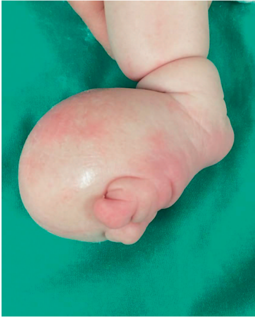
Slika 1a. Novorođenče u dobi od 12 dana, izgled desnog stopala Figure 1a. Newborn - 12 days old. The appearance of the right foot