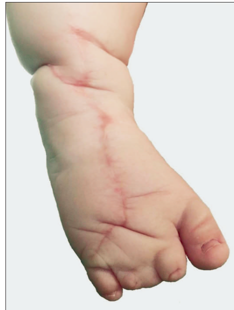
Slika 3. Zadovoljavajući estetski rezultat desnog stopala godinu dana nakon operacije Figure 3. Satisfying esthetic result of the right foot one year after surgery

dobro vaskularizirana te je nalaz isključio dijagnozu limfedema prisutnog u sindromu amnijske brazde. Zatim su magnetskom rezonancijom snimljeni stopalo i potkoljenica. Na snimci su promjeri potkoljenice iznad i ispod strangulacijske brazde bili gotovo podjednaki (4 cm), a na mjestu strangulacijske brazde potkoljenica je imala promjer od 2,3 cm. Promjena na dorzumu stopala (promjera oko 7 cm) opisana je MR-om kao limfedem, no nalaz je