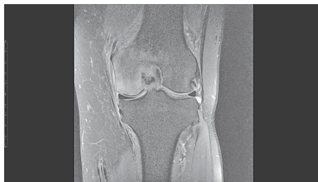
SLIKA 1. MAGNETSKA REZONANCA LIJEVOG KOLJENA (KORONARNI PRESJEK, FAT-SATURATED PROTON-DENSITY WEIGHTED SEKVENCA) NA KOJOJ SE VIDI EDEM KOŠTANE SRŽI I INFRAKCIJA SUBHONDRALE KOSTI MEDIJALNOG KONDILA FEMURA, ŠTO UPUĆUJE NA SPONTANU OSTEONEKROZU KOLJENA (SLIKA JE IZ ARHIVE AUTORA ČLANKA)

Nakon kliničkog pregleda uvijek valja načiniti standardnu radiološku obradu koljena. 4,40 Dok u početnom stadiju SONK-a najčešće nema nikakvih znakova oštećenja, u kasnijim se stadijima javljaju karakteri-