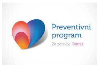
Slika 7.HZJZ. Logo Nacionalnog programa ranog otkrivanja raka pluća Republike Hrvatske [slika s interneta]. [13.5.2023.]. Dostupno na: https://www.hzjz.hr/sluzba-epidemiologija-prevencija-nezaraznih-bolesti/nacionalni-program-ranog-otkrivanja-raka/

Ciljna skupina su osobe u dobi od 50 do 75 godina, aktivni pušači ili su prestali pušiti unutar 15 godina prije probira te imaju najmanje 30 godina. Nacionalni program ranog otkrivanja raka pluća ima dva cilja: