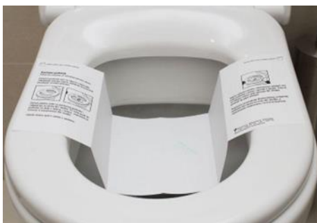
Slika 6. ZZJZ Dubrovačko-neretvanske županije. Sanitarni predložak za testiranje [slika s interneta]. [pristupljeno 25.7.2023.]. Dostupno na: https://www.zzjzdnz.hr/zdravlje/prevencija-raka/565

Ispunjeni anketni listić i testove potrebno je vratiti u roku od 1-2 dana na očitavanje. Osobe s pozitivnim nalazom testa kontaktirat će djelatnici Zavoda za javno zdravstvo (28). Odaziv na poziv četvrtog ciklusa (završenog u svibnju 2021. godine) je 24-52%, ovisno o županiji i godištu, a veći je u starijoj dobnoj skupini. Procijenjeni udio osoba koje su dale uzorak stolice na pregled je 21% od ukupno pozvanih. Za vrijeme prvog dijela ciklusa, u nekoliko županija postignut je znatan porast broja odazvanih osoba na koji je direktan utjecaj imao rad patronažnih sestara na mjestu stanovanja građana te utvrđivanja onih koji ne žive na postojećoj adresi (28).