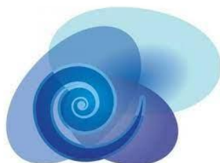
Slika 4. HZJZ. Logo Nacionalnog programa ranog otkrivanja raka debelog crijeva Republike Hrvatske [slika s interneta]. [13.5.2023.]. Dostupno na: https://www.hzjz.hr/sluzba-epidemiologija-prevencija-nezaraznih-bolesti/nacionalni-program-ranog-otkrivanja-raka/

Rak debelog crijeva (kolorektalni karcinom) treće je po redu sijelo raka u svijetu, nakon raka dojke i raka pluća. Prema procjenama Svjetske zdravstvene organizacije, godišnje od njega oboli oko 2 milijuna osoba, a umre 0,95 milijuna (27). Većina bolesnika starija je od 50 godina ako se bilježi značajan porast obolijevanja mlađih osoba. Nacionalni program ranog otkrivanja raka započeo je 2008. godine. Ciljana skupina u programu su žene i muškarci od 50 do 74 godina starosti. Potrebno je da su u periodu od tri godine obuhvaćeni Programom ili imaju uobičajen rizik za nastanak raka (28). Ožujak je, prema mnogim europskim i svjetskim zemljama, posvećen borbi protiv raka debelog crijeva.