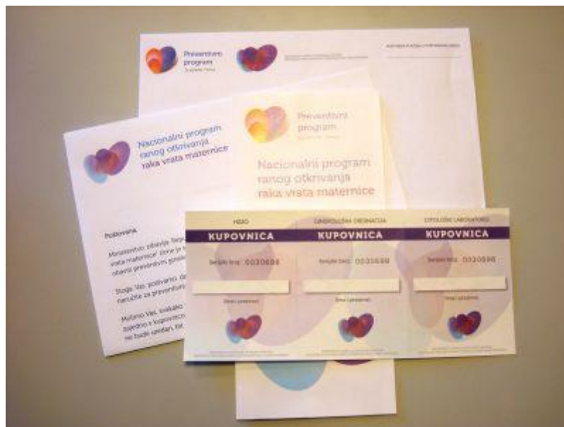
Slika 3. ZZJZ Dubrovačko-neretvanske županije. Prikaz sadržaja pozivnog pisma Nacionalnog programa ranog otkrivanja raka vrata maternice [slika s interneta]. [pristupljeno 25.7.2023.]. Dostupno na:

Istovremeno je donesen Protokol postupka ranog otkrivanja raka vrata maternice: Županijski zavodi za javno zdravstvo šalju pozivna pisma na kućne adrese. Pismo se sastoji od pisanih uputa, kontakt podacima izabranog ginekologa, kupovnice (zamjenski prikaz uputnice) za pregled i PAPA test te edukativni letak (slika 3).