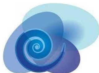
Slika 4. HZJZ. Logo Nacionalnog programa ranog otkrivanja raka debelog crijeva Republike Hrvatske [slika s interneta]. [13.5.2023.]. Dostupno na: https://www.hzjz.hr/sluzba-epidemiologija-prevencija-nezaraznih-bolesti/nacionalni-program-ranog-otkrivanja-raka/

Rak debelog crijeva (kolorektalni karcinom) treće je po redu sijelo raka u svijetu, nakon raka dojke i raka pluća. Prema procjenama Svjetske zdravstvene organizacije, godišnje od njega oboli oko 2 milijuna osoba, a umre 0,95 milijuna (27). Većina bolesnika starija je od 50 godina ako se bilježi značajan porast obolijevanja mlađih osoba. Nacionalni program ranog otkrivanja raka započeo je 2008. godine. Ciljana skupina u programu su žene i muškarci od 50 do 74 godina starosti. Potrebno je da su u periodu od tri godine obuhvaćeni Programom ili imaju uobičajen rizik za nastanak raka (28). Ožujak je, prema mnogim europskim i svjetskim zemljama, posvećen borbi protiv raka debelog crijeva.