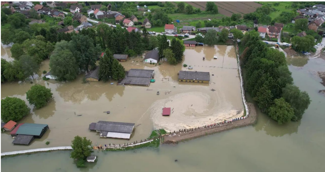
Slika 2. Poplavljeno područje Galdova

razdoblju od 15. do 22. svibnja. Zahvatila je 15 županija. Poplavljene su bile kuće, gospodarski objekti, javna infrastruktura, ceste te poljoprivredne površine. Poplava je uzrokovala aktivaciju nekoliko klizišta te odrona zemlje. Učestali su bili prekidi u prometu, opskrbi strujom i vodom [48]. Izvanredno stanje je proglašeno za mjesta Karlovac, Hrvatska Kostajnica, Farkašić, Krkanec [48]. U prigradskom naselju Galdovo u Sisku (Savska ulica) došlo je do propuštanja vodenih box barijera na Savskom nasipu te je poplavljeno nekoliko objekata u tom dijelu ulice (prostorije Udruge za terapijsko i rekreacijsko jahanje Kas, prostorije Gradskog društva Crvenog križa i prostorije Streličarskog kluba). Razmjer katastrofe vidljiv je na slici 2. [49] Nakon povlačenja vode prva implementirana mjera uključila je čišćenje i dezinfekciju stambenih i javnih prostora, te odvoz glomaznog otpada, a vatrogasci i pripadnici Državne intervencijske postrojbe civilne zaštite vršili su ispumpavanje vode [48]. Zavod za javno zdravstvo istovremeno je s povlačenjem vode organizirao rad terenskih jedinica koje vrše izvide na terenu i daju stručne upute o postupku čišćenja i dezinfekcije prostora, površina i predmeta koji su bili u dodiru s onečišćenom vodom.