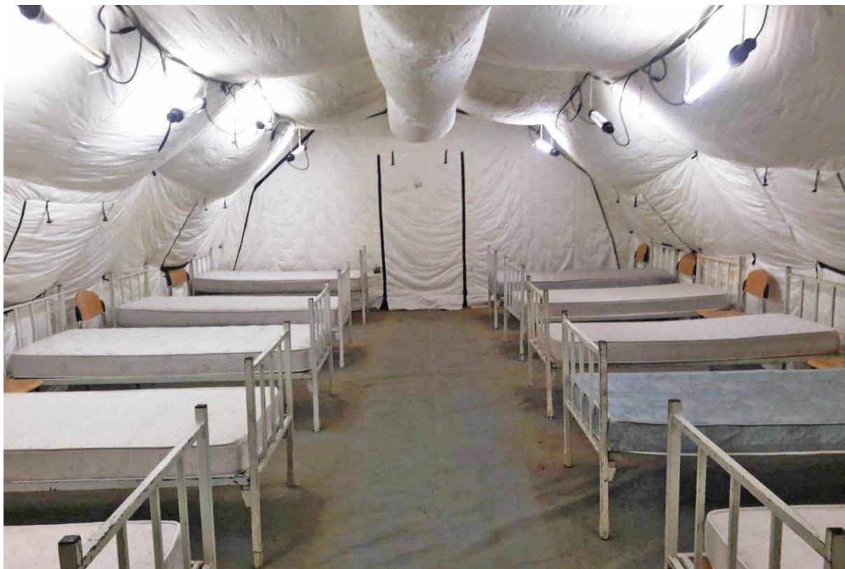
Slika 3. Unutrašnjost šatora prilagođenog za prijem pacijenata nakon potresa u Sisačko-moslavačkoj županiji

nabavu vanjskih sanitarnih čvorova, i dodatnih kontejnera. Šatori su bili grijani i imali su sproveden sustav struje i ventilacije zraka (Slika 3.) [65]. Bolnica je djelovala tijekom kombinirane izvanredne situacije (potres i epidemija COVID-19).