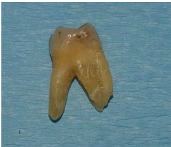
Slika 1. Ekstrahirani zub