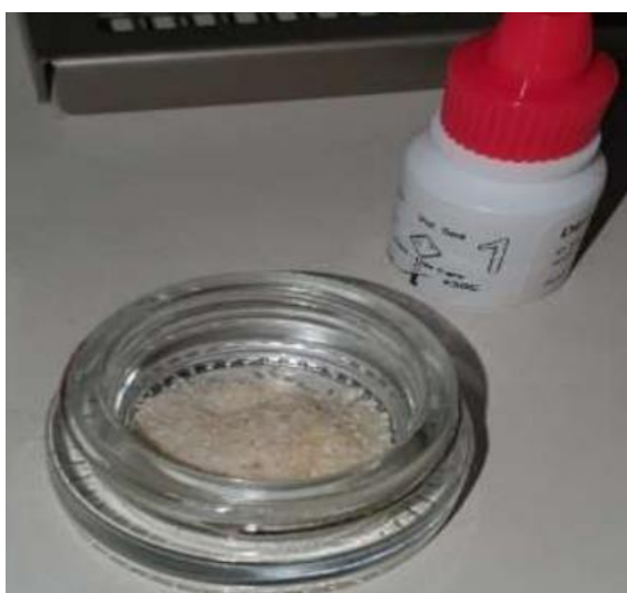
Slika 3. Otopina za ispiranje