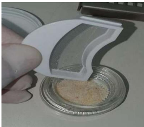
Slika 2. Dentinski prah nakon drobljenja