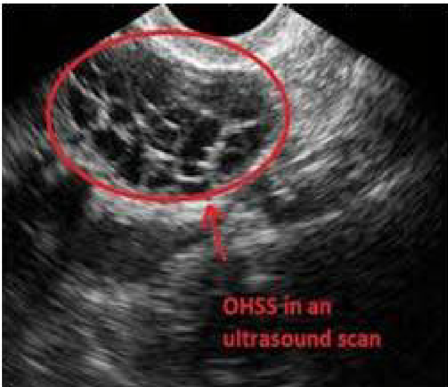
Slika 1. OHSS na ultrazvuku. Vidi se povećan jajnik ispunjen cistama.