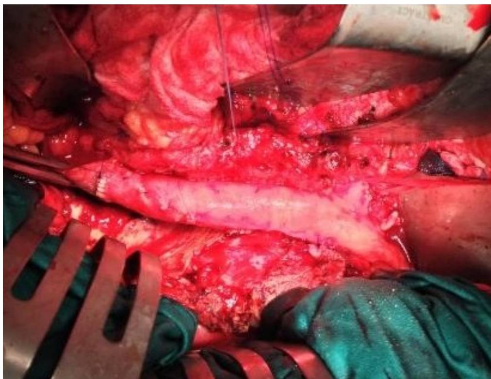
Slika 6. Operacijski nalaz nakon ekstirpacije inficiranog aortnog grafta i rekonstrukcije inficirane pseudoaneurizme na distalnoj anastomozi grafta krioprezerviranim arterijskim homograftom.