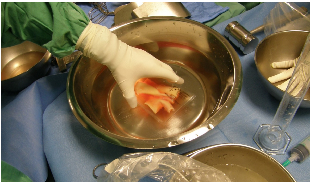
Slika 2. Homograft u plastičnom spremniku.