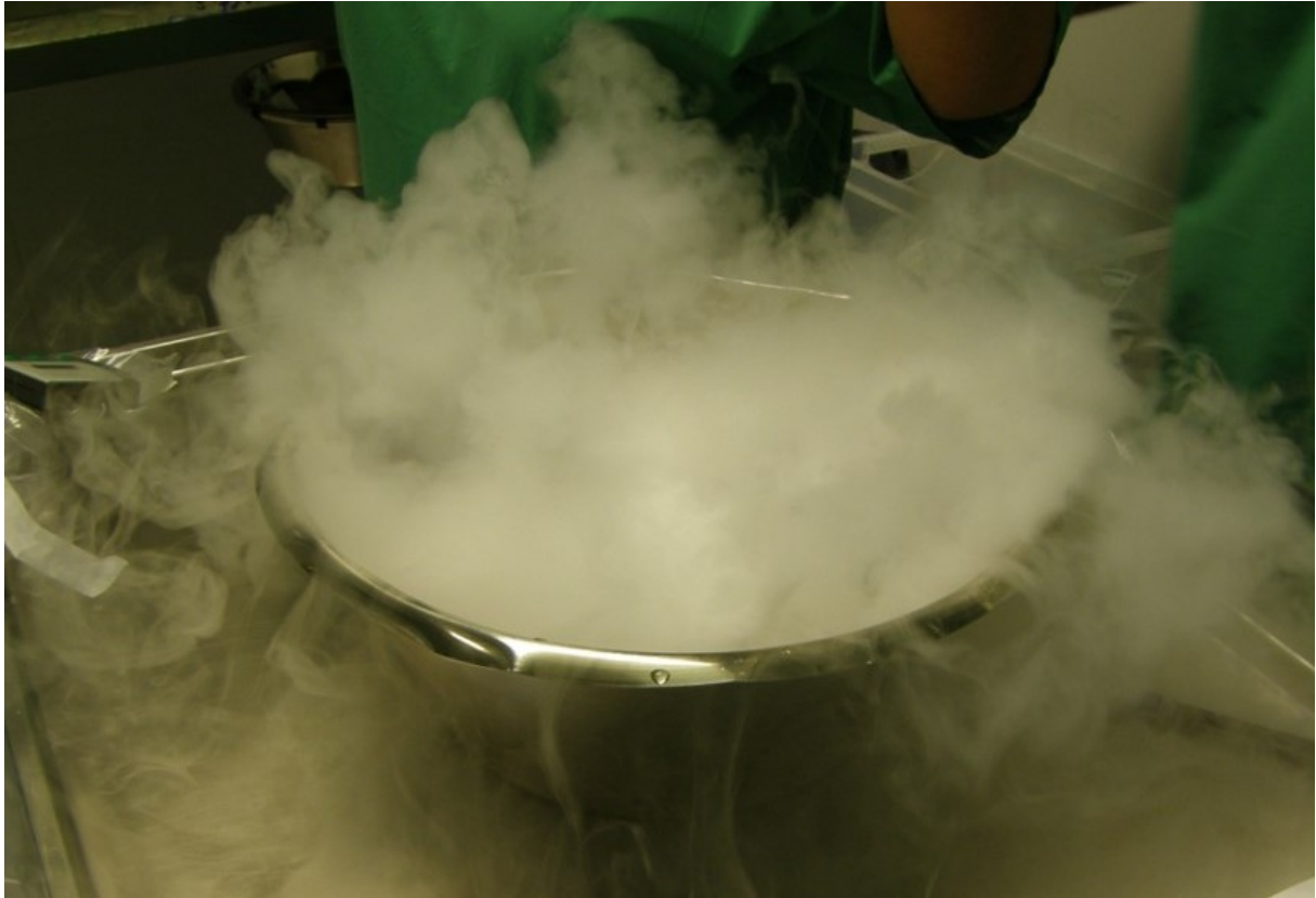
Slika 1. Homograft u parama tekućeg dušika