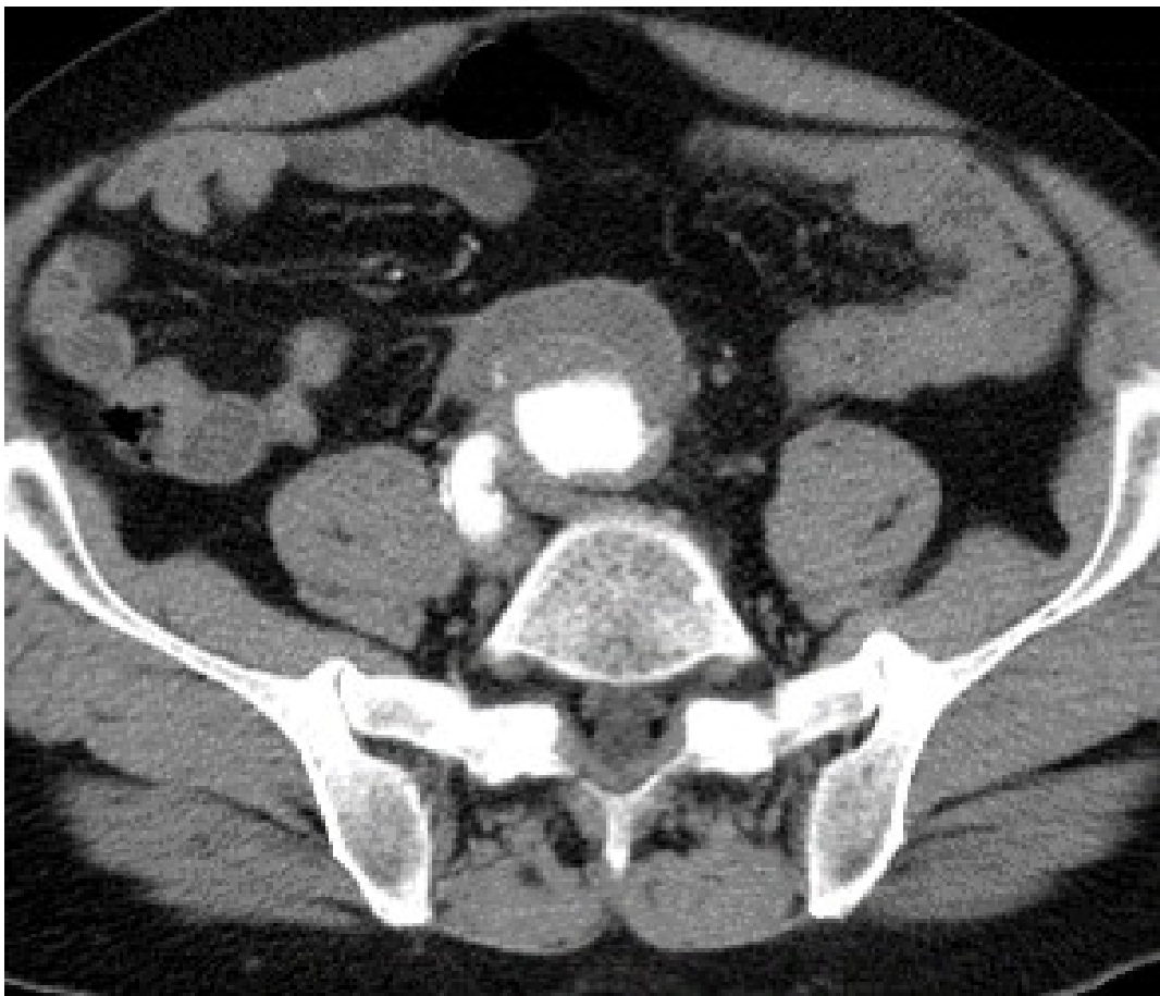
Slika 4. MSCT aortografija kod bolesnika s inficiranom pseudoaneurizmom na distalnoj anastomozi aortnog grafta, neposredno iznad bifurkacije aorte.

Kod šest bolesnika se radilo o infekciji u preponi, kod četiri o infekciji grafta abdominalne aorte (Slika 4-6), kod jednoga o infekciji u području distalnog dijela luka aorte, kod još jednoga o mikotičnoj suprarenalnoj aneurizmi abdominalne aorte, a kod posljednjeg o aneurizmi na distalnoj anastomozi aortokarotidne premosnice.