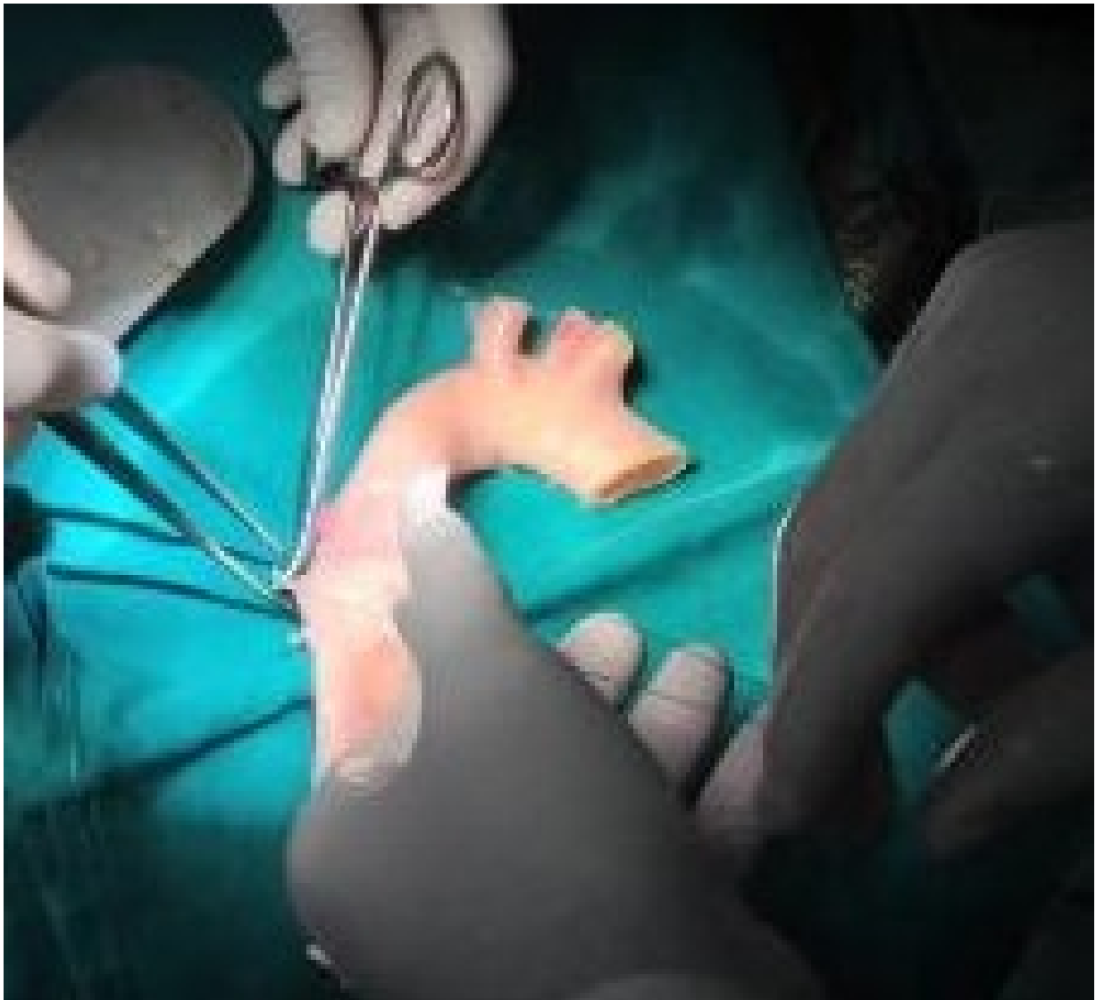
Slika 3. Podvezivanje interkostalnih arterija na homograftu.

Još nije sasvim poznato zašto homograftovi razvijaju toleranciju unatoč nepodudarnosti krvnih grupa. Neki autori, poput Westa i suradnika (14), su dokazali imunološku toleranciju nakon ABO-nepodudarne transplantacije srca u djece. To sugerira da ranija izloženost nepodudarnim ABO antigenima tokom života može dovesti do razvoja imunološke tolerancije. Unatoč imunološkoj toleranciji, neka istraživanja su ipak pokazala histološke promjene na krioprezerviranim arterijskim homograftovima, u obliku fibrotičnih promjena s minimalnom staničnom infiltracijom u intimi i medijalnom sloju stijenke, te pojedinačnih naslaga s ekspresijom antigena krvnih grupa na endotelu, i difuznom ekspresijom tih antigena