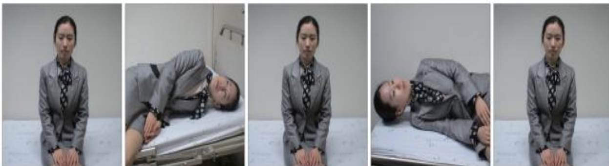
Slika 4. Brandt-Daroffove vježbe.(33)

Vježbanje se izvodi dva tjedna, ali vrlo često već nakon prvih 5 do 6 dana zbog privikavanja dolazi do prestanka simptoma bolesti. Tada se vježbanje ponovi i sljedećeg dana. Ako se simptomi bolesti ni tada ne jave, s vježbanjem se potpuno prestaje.