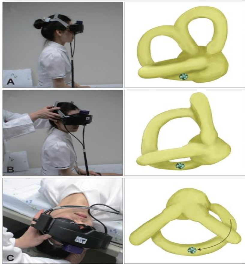
Slika 1. Dix-Hallpiekov test. (33)

Ukoliko je uzrok vrtoglavice teško dijagnosticirati, te osoba nema karakterističan nistagmus, a ima druge neurološke ispade (dvoslike, poremećaj govora, motorički ispadi itd.) ili pak vrtoglavicu koja ne odgovara na terapiju, liječnik treba naručiti bolesnika na dodatne pretrage, kao što su: magnetska rezonancija, elektronistagmografija, videonistagmografija i audiometrija.