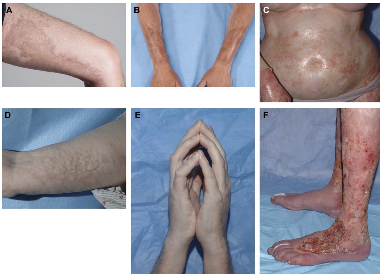
Slika 1. Kožne manifestacije sklerodermiformnog oblika kronične reakcije transplantata protiv primatelja. Lokalno zadebljanje s hiperpigmentacijom u obliku plaka na bedru (A) i podlakticama (B) koje nalikuje lokaliziranoj sklerodermiji (sclerodermia circumscripta). Glatka, sjajna, indurirana koža trupa nalikuje generaliziranoj sklerodermiji te može dovesti do ograničenja ekspanzije toraksa (C). Potkožna i fascijalna fibroza prezentira se nepravilnim, naboranim izgledom kože, te nalikuje eozinofilnom fascitisu (D) te može rezultirati kontrakturama zglobova, uključujući znak molitvenika (E). Kao posljedica dugotrajnog sklerodermiformnog cGVHD-a dolazi do oštećenja kože i teškog zacjeljivanja rana osobito na donjim ekstremitetima, te povisuje rizik sistemnih infekcija (F).