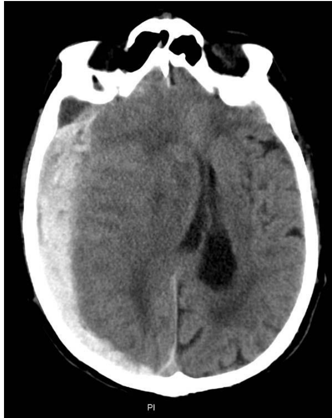
Slika 3 – CT snimak. Veliki desnostrani subduralni hematom uzrokuje pomak moždanog tkiva preko središnje linije i subfalcinu hernijaciju; uočiti pomak lateralnih komora.

Lezije smještene u hemisferama velikog mozga mogu izazvati subfalcinu hernijaciju, u kojoj se medijalni dijelovi frontalnog režnja ( gyrus cinguli ) podvlače ispod falx cerebri (sagitalna pregrada koja dijeli dvije hemisfere velikog mozga) i šire na suprotnu stranu. Time oštećuju sebe, ekvivalentne strukture suprotne strane i sve dijelove pod krvnom opskrbom perikalozalnog dijela a. cerebri anterior . 85