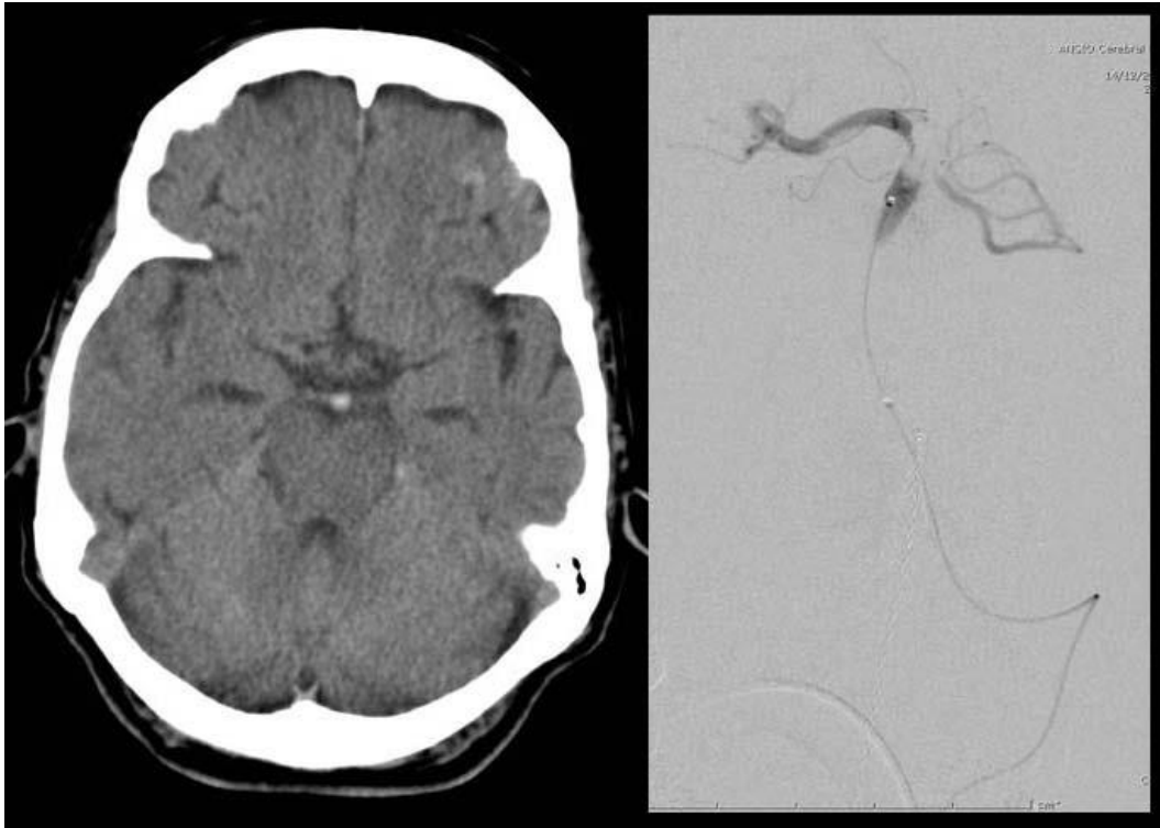
Slika 4 – Lijevo: CT nalaz kod pacijenta s akutnom hemiparezom i poremećajem svijesti; Desno: nalaz digitalne subtraksijske angiografije kod istog pacijenta, vidljiva okluzija vrha bazilarne arterije.

lokalizaciji se moguće orijentirati tražeći ispade funkcije tih struktura neurološkim pregledom, a za potvrdu se mogu učiniti neuroradiološke pretrage. Na CT-u se bazilarna okluzija, kao i većina ishemijskih lezija, slabo vidi u akutnoj fazi. Zato se najbolje poslužiti nekom od angiografskih metoda. U KBC Zagreb se kod pacijenata sa sumnjom na ishemijski moždani udar koji su unutar vremenskog okvira za intervenciju rutinski radi CT angiografija.