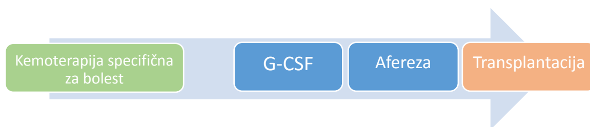
Slika 1. Steady-state mobilizacija

Filgrastim se aplicira u dnevnoj dozi od 10 \mu\text{g} / kg / dan kao jedna supkutana injekcija 5 do 7 uzastopnih dana dok se lenograstim primjenjuje 4 do 6 dana. Budući da uporabom „steady-state“ mobilizacije broj CD34+ stanica u PK doseže zenit između 4. i 6. dana od početka primjene, nadzor nad tom vrijednošću trebao bi započeti 4. ili 5. dan protokola. Leukafereza se učini 5. ili 6. dan primjene (filgrastim), odnosno između 5. i 7. dana (lenograstim). Također, sve više podataka govori u prilog uspješnosti 12 mg pegfilgrastima kao jedne supkutane doze. Međutim, pegfilgrastim još nije široko prihvaćen od transplantacijskih centara, što se može pripisati uhodanoj i pouzdanoj uporabi G-CSF-a i cijeni preparata (Mohty et al. 2014, Duong et al. 2014).