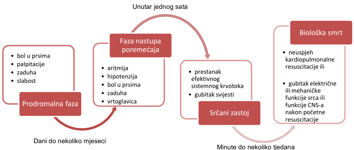
Grafički prikaz 2. Patogeneza iznenadne srčane smrti kroz četiri vremenski odijeljene faze. Modificirano prema Mann et al. (2015) Braunwald's Heart Disease, str. 882.

Mellor et al. su proveli retrospektivno kohortno istraživanje kliničkih karakteristika i okolnosti ISS-a u Velikoj Britaniji, u periodu između 1994. i 2010. godine, u sklopu kojega su proučili 967 slučajeva ISS-a sa strukturno urednim srcem na obdukcijском nalazu. Čak 90% tih slučajeva nije imalo prisutnih simptoma u prodromalnoj fazi niti bilo kakav prepoznati rizični čimbenik za razvoj ISS-a (Mellor et al., 2014).