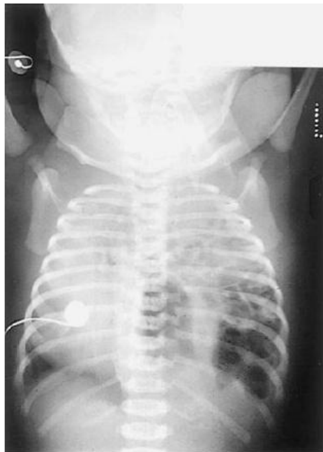
SLIKA 2. DIJAFRAGMALNA HERNIJA (ljevostrani Bochdalekov defekt)