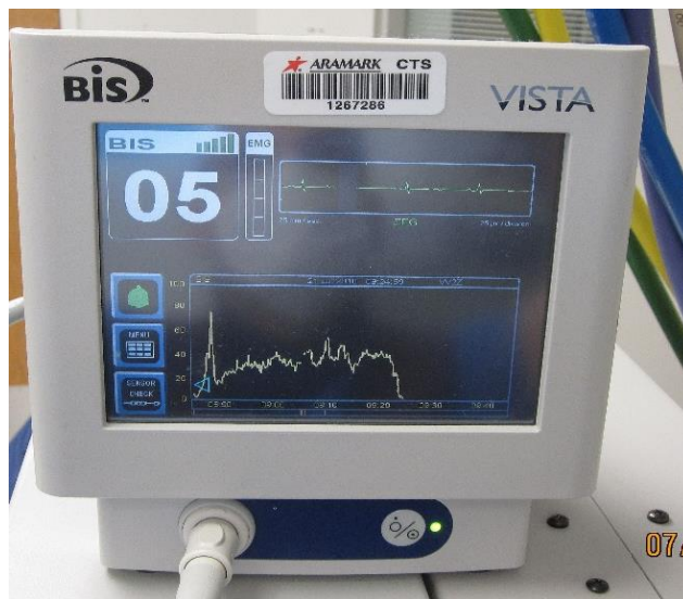
Slika 2. BIS monitor Preuzeto:

BIS monitor koristi algoritam koji uključuje spektralnu i bispektralnu analizu snimljenog EEG zapisa te analizu vremenskog perioda ravnog ili gotovo ravnog EEG zapisa kako bi izračunao vrijednost BIS-a. Spektralna analiza temelji se na Fourierovoj transformaciji čime se složeni zapis raščlanjuje na skup jednostavnijih valova specifične frekvencije i voltaže i tako otkriva one povezane s budnosti( alfa i beta) te nesvjesti( theta i delta). Bispektralna analiza otkriva faznu povezanost između dvaju vrsta valova (12).