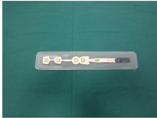
Slika 4. Senzor s elektrodama

Primjenu BIS-a za procjenu dubine anestezije na pedijatrijskim bolesnicima djelomično ograničavaju činjenice da su algoritmi za obradu EEG-a razvijeni retrospektivnom analizom EEG-a prikupljenih tijekom operacijskih zahvata odraslih bolesnika kao i to da su većina istraživanja o učinkovitosti provedena na odraslim bolesnicima (14). Obrasci EEG zapisa mijenjaju se tijekom rasta i razlikuju se ovisno o dobi bolesnika pri čemu su razlike izraženije u novorođenčadi i dojenčadi, a uslijed nedovoljno velikog broja istraživanja, BIS-titrirana anestezija u ovoj populaciji nije preporučena (15).