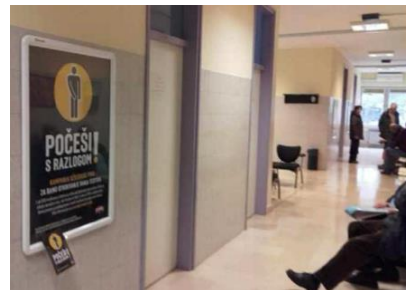
Slika 3.8. B1 poster kampanje „Počeši s razlogom!“