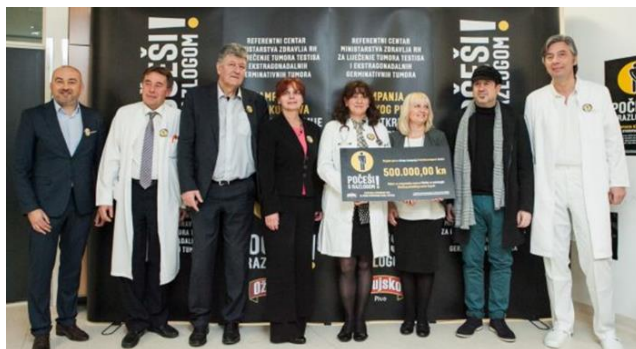
Slika 3.2. Predstavljanje kampanje „Počeši s razlogom!“ u KBC Zagreb. Slika je preuzeta s web stranice: http://www.jutarnji.hr/incoming/zdravstveni-strucnjaci-porucili-%E2%80%93-ovaj-put-pocesi-s-razlogom/29914/

Kampanja je također predstavljena i u KBC-u Zagreb gdje je Ožujsko doniralo 500.000 kuna. (42)