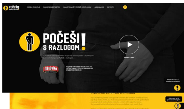
Slika 3.10. Web stranica kampanje „Počeši s razlogom!“

Zahvala gospođi Tini Puhalo Grladinović na ustupljenim slikama.