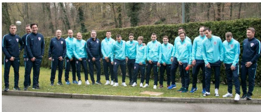
Slika 3.11. Podrška Hrvatske nogometne reprezentacije kampanji „Počeši s razlogom!“

Kampanja su podržali Hrvatska nogometna reprezentacija, HGSS i RK Zagreb.