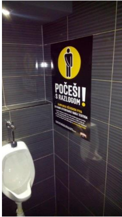
Slika 3.6. B2 plakat kampanje „Počeši s razlogom!“

i postavljeni su B1 posteri i A5 letci u 290 medicinskih ustanova u Hrvatskoj.