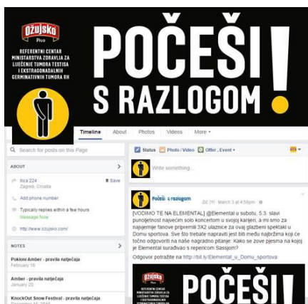
Slika 3.9. Facebook stranica kampanje „Počeši s razlogom!“