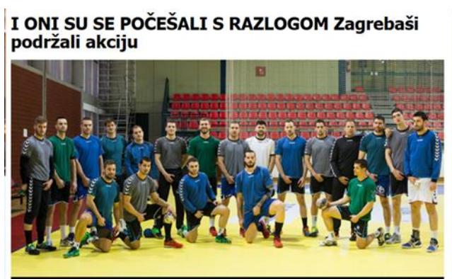
Slika 3.12. Podrška RK Zagreb kampanji „Počeši s razlogom!“