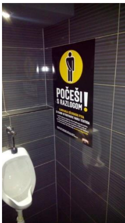
Slika 3.7. B1 poster kampanje „Počeši s razlogom!“

i postavljeni su B1 posteri i A5 letci u 290 medicinskih ustanova u Hrvatskoj.