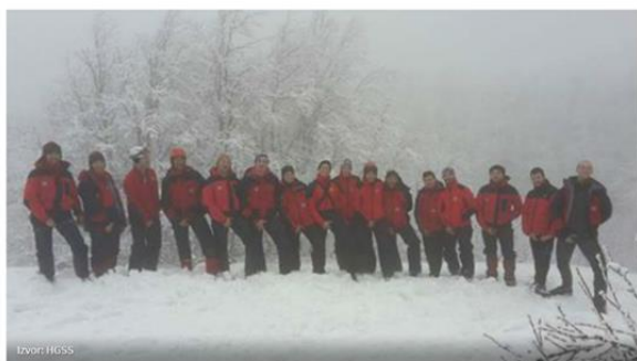
Slika 3.13. Podrška HGSS-a kampanji „Počeši s razlogom!“

Kampanja „Počeši s razlogom!“ i dalje traje. Dosadašnji rezultati kampanje su: