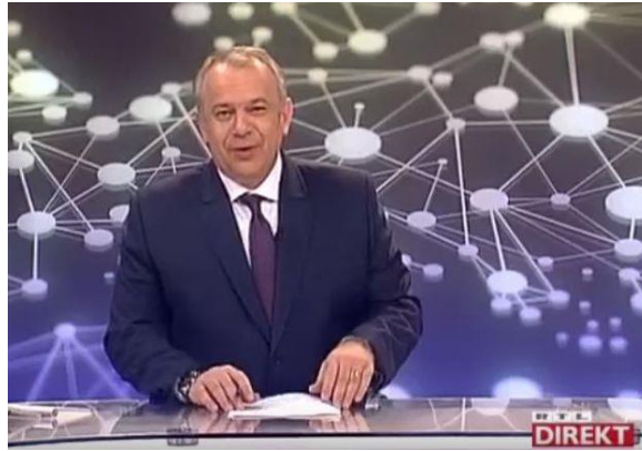
Slika 3.1. Predstavljanje kampanje „Počesi s razlogom!“ u emisiji RTL Direkt.

TV teaser se pokazao uspješnim iz nekoliko razloga: