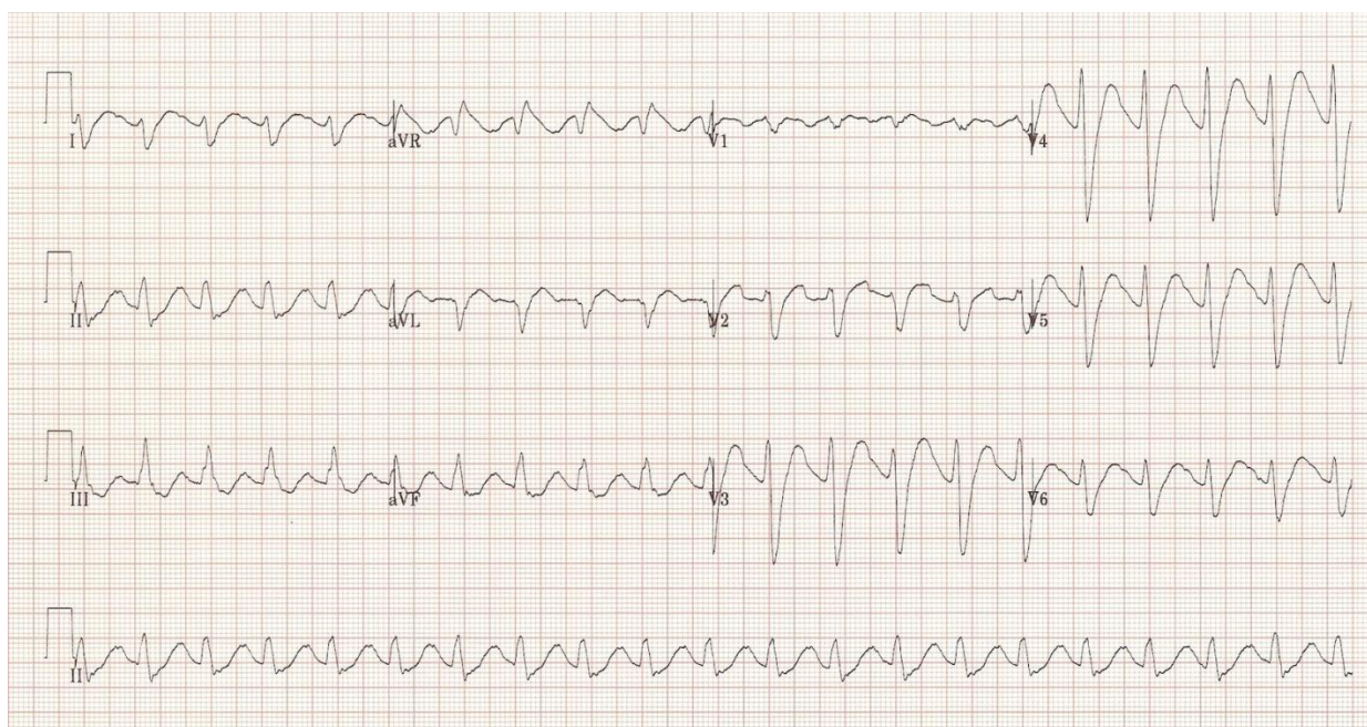
Slika 3: Toksičnost tricikličkih antidepresiva (Prema: Burns E. 2011. Dostupno na: https://i2.wp.com/lifeinthefastlane.com/wp-content/uploads/2011/03/TCA-toxicity.jpg )