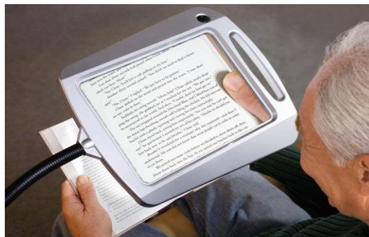
Slika 2. elektronička povećala

U nekoliko skupina možemo podijeliti pomagala za slijepe i slabovidne osobe, a to su optička pomagala, neoptička pomagala, elektronska pomagala. Od jedne ili više postavljenih leća između objekta promatranja i oka sastoje se optička pomagala, u čiju grupu spadaju i medicinski filteri koje dijelimo na teleskope, povećala, apsorptivne filtere za redukciju bliještanja. Povećala dijelimo na elektronska, ručna te džepna povećala. Ono stvara povećanu virtualnu sliku koju oko vidi povećanu odnosno pod većim kutom. S njim ne promatramo objekt već sliku koja se pri tome stvara. Njihova prednost je u tome što su vrlo jeftina pomagala. Ručnim povećalom može se mijenjati veličina povećanja, stolna povećala su pak sredstvo koje je idealno za čitanje, njihova je prednost slika koja je u fokusu. Džepna su povećala pak vrlo praktična. Uvijek mogu biti pri ruci, idealna za kratkotrajno korištenje, a nedostatak im je vrlo malo vidno polje koje imaju, optički lošija. Povećalo u obliku kugle postavljaju se točno na tekst koji se želi povećati ( pogodna za djecu i starije osobe ). Povećala u obliku štapića napravljena su da služe za orijentaciju pri čitanju te povećavaju sliku do dva puta. Naglavna i klip povećala postavljaju se na okvir od naočala.