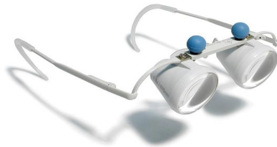
Slika 3. Teleskopske naočale

Najčešći način izrade teleskopskih sustava su teleskopske naočale čija je prednost mogućnost binokularno korištenje, optimalno pozicionirani okulari u odnosu na vidnu os, a nedostaci su nepraktično nošenje, visoka cijena.