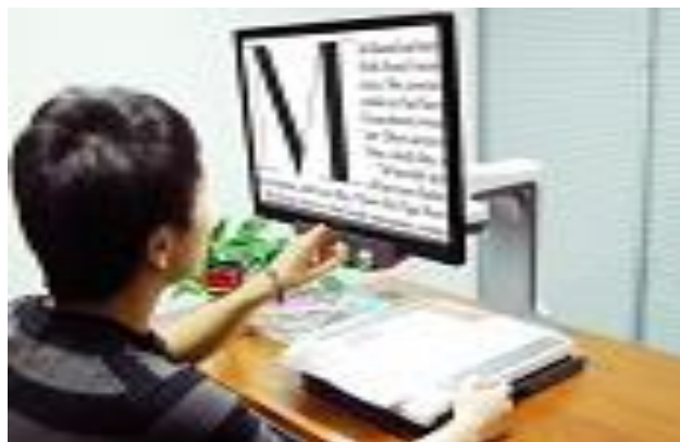
Slika 4. Elektronska povećala

Kod ljudi koji imaju ozbiljna oštećenja vida koriste se elektronska pomagala. Oni su za takve osobe poželjnija opcija jer su prikladne za individualno prilagođavanje povećanja i osvjetljenja, pružajući osobi veće mogućnosti.