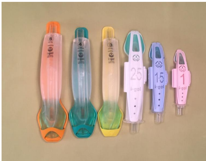
Slika 12 – Supraglotična pomagala (i-gel)

Postavljanje je jednostavno a tehnika se uz minimalno edukacije može savladati. Stražnji dio, iza ovalnog dijela, potrebno je lubricirati. Ako se koristi klasična LMA, drži se poput olovke tako da kažiprst dominantne ruke bude između ovalnog dijela i tubusa. Klizeći po tvrdome nepcu, direktnim načinom, LMA se gura u usnu