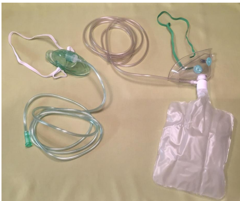
Slika 6 - Maska za kisik (lijevo) i maska za kisik sa spremnikom (desno)

95%. Prije postavljanja maske s rezervoarom na lice bolesnika potrebno je dopustiti da se rezervoar napuni (slika 6). Tijekom inspirija jednosmjerni ventil koji se nalazi između maske i rezervoara se odiže, te bolesnik udiše gotovo 100% kisika koji dolazi iz rezervoara. Istovremeno jednosmjerni ventili na bočnim stranama maske se zatvaraju kako ne bi udahnuo zrak iz okoline. Pri izdisaju dolazi do suprotne situacije. Ventil između maske i rezervoara se zatvara kako bolesnik ne bi izdahnuo u rezervoar već van maske na kojoj se bočni ventili otvaraju te omogućuju izlazak izdahnutoga zraka (9,12).