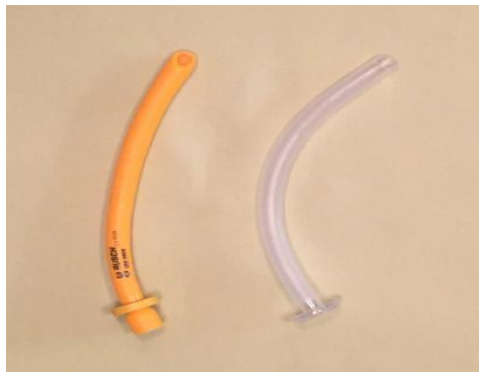
Slika 4 - Nazofaringealni tubusi

Nazofaringealni tubus postavlja se osobama kod kojih je bila nemogućnost postavljanja