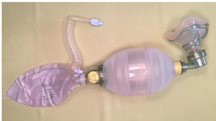
Slika 8 - Samošireći balon s maskom i nastavcima za obogaćivanje kisikom

Ventilirati može jedna ili dvije osobe. Ako ventilira jedna osoba, tada je jednom rukom potrebno pridržavati dobro fiksiranu masku na licu bolesnika dok se drugom upuhuje. Ako to izvode dvije osobe, jedna fiksira masku a druga upuhuje. Međutim u