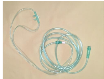
Slika 5 - Nosni kateter

Nosni kateter je cjevčica kojom se primjenjuju minimalne koncentracije kisika (slika 5). Protok kisika koji se isporučuje bolesniku je od 1-6 litara u minuti a koncentracija koja se može primjeniti putem nosnog katetera je 24-44%. Pravilo izračunavanja koncentracije je Lx4+20=\% . Postavlja se prvo kraj katetera u nosnice, nakon toga se krakovi cjevčice stavljaju iza uha bolesnika i nakon toga završava s prednje strane vrata ispod brade gdje se s dodatnim prstenom fiksira. Potrebno je izbjegavati fiksiranje iza glave bolesnika jer se time pritišće kateter i dotok kisika.