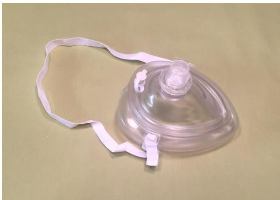
Slika 7 - Džepna maska

(1). U tome slučaju potreban je oprez. Gornji dio maske ne smije ići preko očiju jer pritišće bulbuse koji mogu dovesti do podražaja vagusa i pojave ventrikularne fibrilacije. Na vrhu maske nalazi se jednosmjerna valvula koja omogućava da se izdahnuti zrak bolesnika ne usmjerava na isto mjesto gdje spasioc upuhuje. Samim time, spašavatelj nema direktan kontakt s bolesnikom. Neke maske imaju