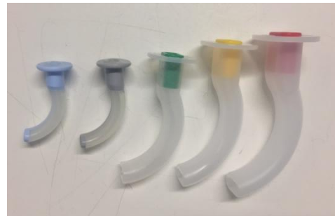
Slika 3 - Orofaringealni tubusi

Orofaringealni tubus najčešće je prvi izbor za održavanje i prohodnost dišnog puta. Napravljen je kako bi spriječio zapadanje jezika i zatvaranje glotisa odnosno dišnog puta. Postoje dvije vrste tubusa, Guedel i Berman. Oba su istoga izgleda ali drugačije dizajnirani. Načinjeni su od tvrde nesavitljive plastike koji na gornjem dijelu imaju pločasti dio koji nasjeda na usne nakon