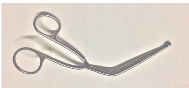
Slika 2 - Magillova hvataljka

odlazak sadržaja dublje prema plućima. Strano tijelo koje je kruće te se zaglavilo i teško ga je aspirirati može se izvaditi pomoću Magillove hvataljke (slika 2) također