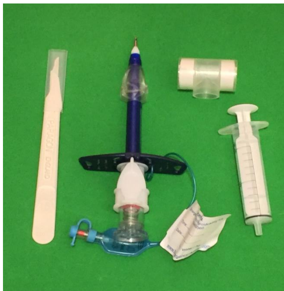
Slika 13 - Set za konikotomiju

krikotiroidotomiju. Svako vozilo hitne medicinske službe (HMS) mora biti opremljeno sa setom za konikotomiju. U tome setu nalazi se tubus, poveska za pričvršćivanje, brizgalica, skalpel i filter zraka (slika 13). Većina tubusa, ovisno o proizvođaču, imaju i balon za napuhavanje. Postupak otvaranja dišnog puta konikotomijom je sljedeći. Locira se krikotiroidna membrana te se vrši incizija kože okomito oko 2 cm. Nakon što se probije koža i dođe do