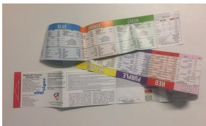
Slika 11 - Broselowljeva traka

Pokazalo se da uspješnost ETI ovisi o vještini i iskustvu (21). Henlin i sur. (19) navode da bi ETI tijekom oživljavanja u prehospitalnim uvjetima trebao izvoditi iskusni spašavatelj. Neuspješne ETI nisu direktno povezane s povećanjem smrtnosti ali mogu biti uzrokovane uvjetima rada koji su