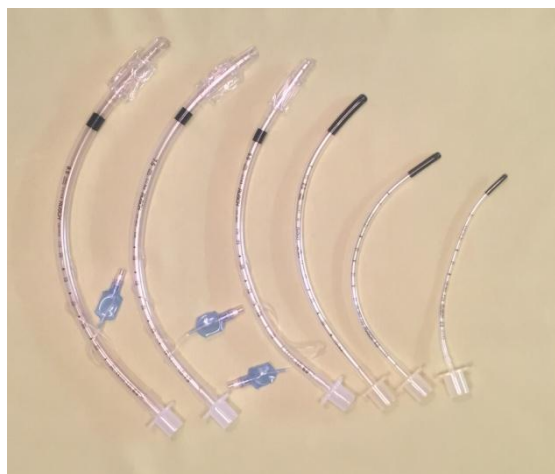
Slika 10 - Endotrahealni tubusi sa i bez balončića

Tijekom pripreme opreme, bolesnika je potrebno što više oksigenirati. Položaj glave tijekom intubacije morao bi biti u položaju njušenja. Laringoskop se drži u lijevoj ruci. Spatula laringoskopa postavlja se uz desni kut usana te ulazi u usnu šupljinu odgurujući jezik u lijevo. Nakon odgurivanja jezika, s vrhom spatule klizne se bazom jezika u valekulu iznad epiglotisa te se odigne prema naprijed kako bi se ukazale glasnice pritom ne oslanjajući se na zube i usne. Pri vizualizaciji dodaje se ETT te se pod kontrolom oka tubus gura kroz glasnice (18). Ako je došlo do regurgitacije