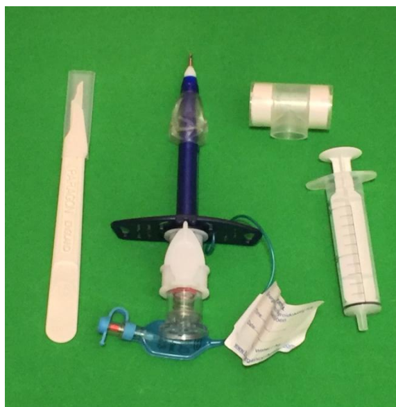
Slika 13 - Set za konikotomiju

krikotiroidotomiju. Svako vozilo hitne medicinske službe (HMS) mora biti opremljeno sa setom za konikotomiju. U tome setu nalazi se tubus, poveska za pričvršćivanje, brizgalica, skalpel i filter zraka (slika 13). Većina tubusa, ovisno o proizvođaču, imaju i balon za napuhavanje. Postupak otvaranja dišnog puta konikotomijom je sljedeći. Locira se krikotiroidna membrana te se vrši incizija kože okomito oko 2 cm. Nakon što se probije koža i dođe do