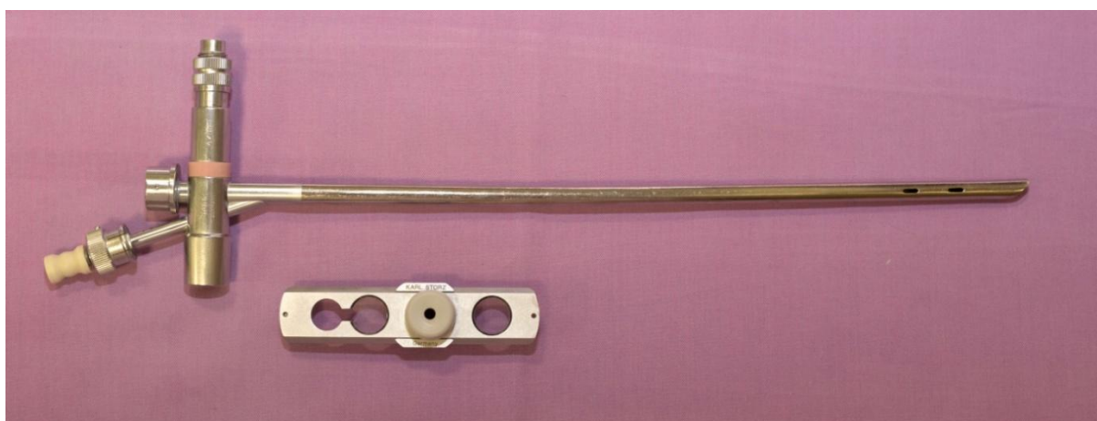
Slika 4. Rigidni bronhoskop. Odvojeni dio omogućuje gledanje kroz otvor zatvoren staklom, usisavanje sekreta kroz otvor na gumenom čepu ili ulazak hvataljke kroz najširi otvor. Svi otvori su na klizaču i mogu se pomicati na kanal bronhoskopa prema potrebi. Nastavak prema gore služi za izvor svjetla, dok se nastavak prema dolje spaja na anesteziološki aparat.

Prema Dongu i Fangu (25,37) fleksibilna bronhoskopija je bila uspješna u 90% i 96.5% slučajeva i smatraju je jednakovrijednom metodom ekstrakcije. U neuspješnim ekstrakcijama uz upotrebu fleksibilnog bronhoskopa, pribjegava se rigidnoj bronhoskopiji. Prednost FLB je mogućnost ekstrakcije uz sedaciju i lokalnu anesteziju, bolji pristup dišnim putovima s manjim promjerom te izostanak ozljeda zuba, glasnica i bronhialne sluznice ( Slika 5 ). Fleksibilni bronhoskop se može priključiti na video–stup u boji što olakšava vizualizaciju dišnih putova i dokumentiranje nalaza ( Slika 6 ). Unatoč navedenim prednostima, FLB se češće koristi kao dijagnostička metoda kod pacijenata s nejasnim znakovima aspiracije dok se RB koristi za uklanjanje stranog tijela nakon pozitivnog nalaza FLB ili kod pacijenata s jasnom kliničkom slikom. Prednost RB je u širini bronhoskopa koja omogućuje bolju vizualizaciju, dobru ventilaciju te primjenu različitih instrumenata ( Slika 7 i 8 ) (27,38). Strano tijelo može biti prekriveno granulacijskim tkivo koje se tada uklanja krioterapijom ili argon plazma koagulacijom (25,37).