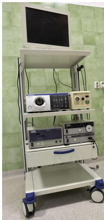
Slika 6. „Video stup“ za bronhoskopiju.