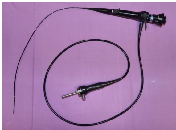
Slika 5. Fleksibilni bronhoskop.