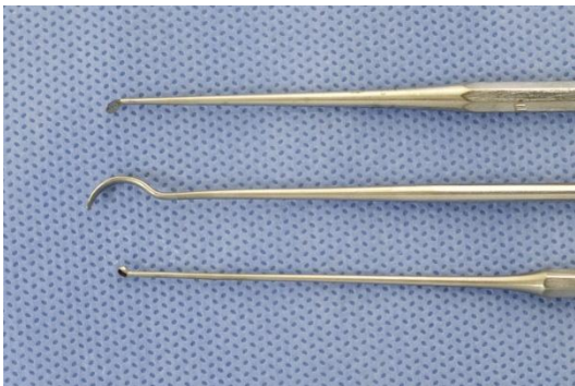
Slika 1. Instrumenti za vađenje stranih tijela iz uha i nosa.

Zaglavljeno tijelo se u većini slučajeva detektira direktnom inspekcijom. Najviše korištene metode ekstrakcije su ispiranje zvukovoda pomoću šprice te korištenjem različitih instrumenata prikladnih za određeni tip stranog tijela. (Slika 1 i 2) (19,21,28).