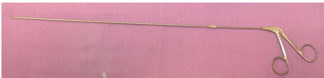
Slika 7. Hvataljka za bronhoskop.