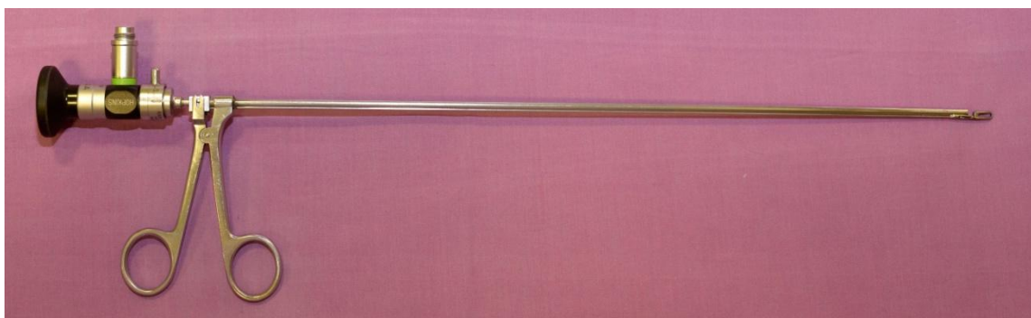
Slika 8. Optička hvataljka za bronhoskop.