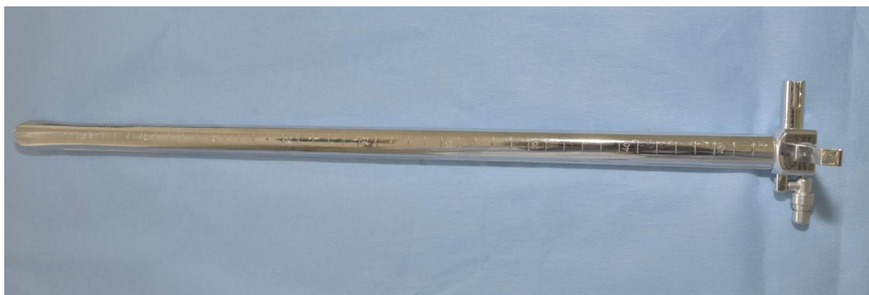
Slika 3. Rigidni ezofagoskop.