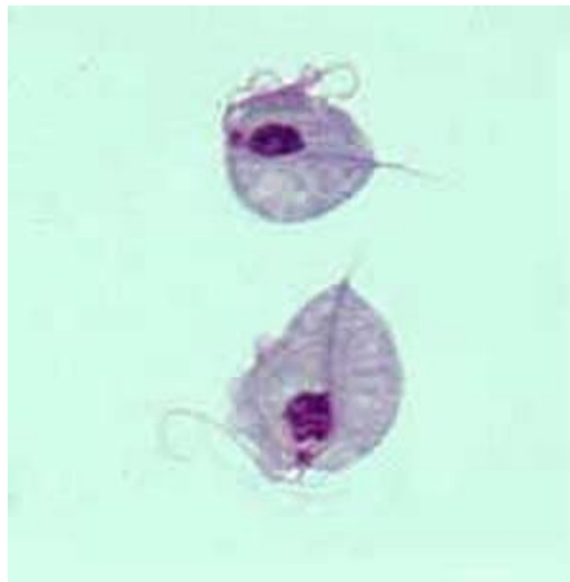
Slika 2. Trofozoit T. vaginalis - preparat bojen po Giemsi