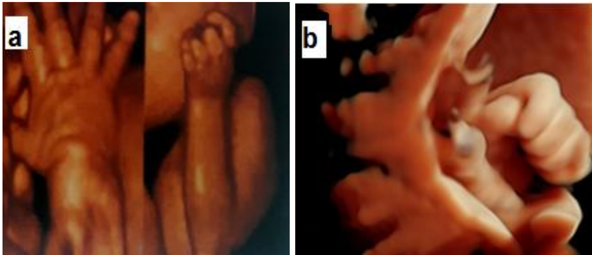
Slika 1. 4D ultrazvučni prikaz fetalnih pokreta ruku. (Modificirano prema ref.146, 148.)

metodom nađena je izmijenjena kvaliteta i broj pokreta, smanjen repertoar pokreta i prisutnost abnormalnih općih pokreta. Osim toga, pronađeni su neurološki palac (palac u čvrsto stisnutoj šaci) i lice poput maske (57). Neurološki palac, znak oštećenja gornjeg motoričkog sustava, važan je nalaz u fetusa koji su patili od teške hipoksije (36,48,58). Neurološki palac prikazan je na slici 1b, a normalan položaj ručica fetusa na slici 1a.