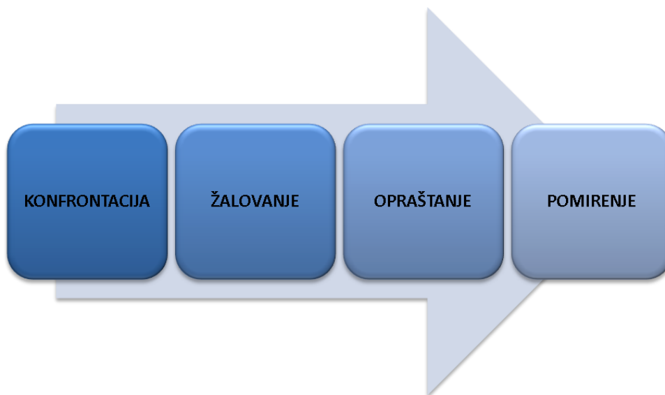
Slika 3. Prema Urlić I. (Urlić, 2004)

Osim koncepta M. Klein, trebali bi navesti još dva koja su pridonijela razumijevanju opraštanja. Jedna je Winicottova teorija o preživljavanju majke koja kao dovoljno dobra majka dopušta da bude iskorištavana od svog nemilosrdnog i kanibalističkog djeteta. Njegov bijes proizlazi iz njenih neizbježnih propusta, no ona ga svejedno uspijeva preživjeti te u konačnici dijete samo počinje uviđati majčin oprost kroz koji uči kako ga prihvatiti. Identifikacijom s njom razvija se kapacitet za sva buduća opraštanja. Sljedeća je Mahlerova teorija o majčinoj elastičnosti za vrijeme djetetovih kontradiktornih zahtjeva za bliskošću/distancom, zaštitom/slobodom, intimnošću/autonomijom. Njeno modeliranje agresije dopušta djetetu da uvidi kako ga ona niti guši niti napušta te internalizira realističniji pogled na nju. Tako nastaje konstantnost objekata, uz konstantnost selfa, što omogućava prihvaćanje i opraštanje agresije uzrokovane frustracijama (Akhtar, 2002).