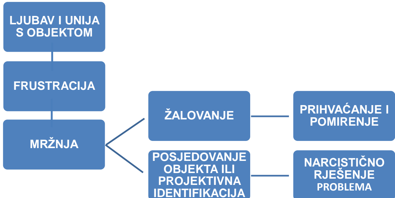
Slika 2. Shematski prikaz narcističnog rješenja frustracije

postoje. Gubitak veza doživljavaju kao diskontinuitet vlastitog postojanja, ili prema Winnicottovim pojmovima, nemaju kapaciteta za samoću. Dakle povezani su sa svijetom kroz mržnju za koju se pretpostavlja da potječe iz mržnje prema doživljaju majke. Moguće da je majka bila frustrirajuća, nedostupna ili projektivno identificirala svoju nesvjesnu mržnju u dijete što je dovelo do djetetove ogorčenosti i fiksacije u analnu fazu gdje su sve razlike netolerabilne. Mržnja postaje sredstvo kontrole majke i molbe za grafikaciju, pruža izbjegavanje bolnih osjećaja napuštanja i separacije. Jedna od definicija narcizma tako može biti i poremećaj prekomjerne mržnje (Mann, 2013).