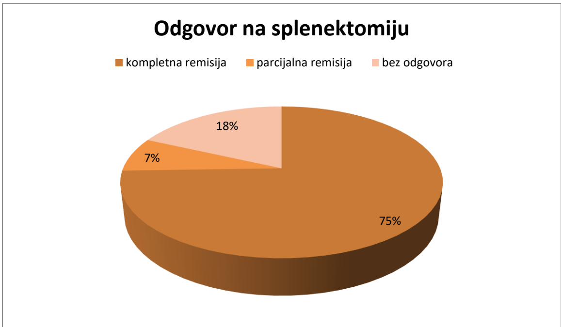
Slika 1. Inicijalni odgovor na splenektomiju.