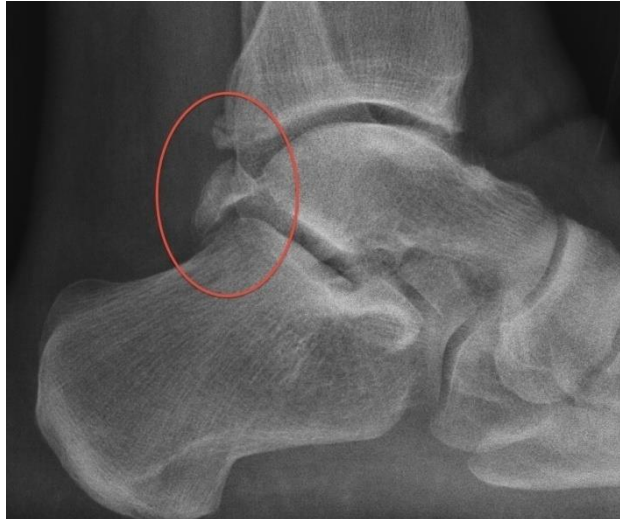
Slika 3. Lateralna rendgenska snimka stopala: zaokružena os trigonum