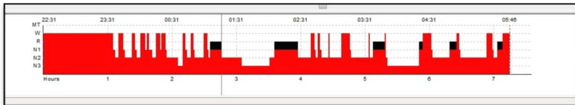
Slika 2. Hipnogram – grafički polisomnografski prikaz spavanja 15-godišnjeg djeteta. REM faze spavanja obojene su crno. Vidljiva je produžena latencija spavanja – 60 minuta.

Spavanje je također ritmički organizirano, u ciklusima koji se izmjenjuju tijekom noći (ultradijalni ritam). Spavanje se sastoji od REM spavanja i NREM spavanja. NREM spavanje sastoji se od faze 1 spavanja (tranzicija iz budnosti u spavanje), faze 2 spavanja i sporovalnog spavanja - faza 3.