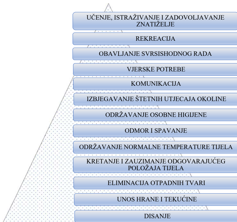
Slika 2. Osnovne ljudske potrebe prema V.Henderson

V. Henderson je definirala osnovne ljudske potrebe te ih svela u 14 kategorija; disanje, unos hrane i tekućine, eliminacija otpadnih tvari, kretanje i zauzimanje odgovarajućeg položaja tijela, spavanje i odmor, održavanje normalne temperature tijela, održavanje osobne higijene, izbjegavanje štetnih utjecaja okoline, komunikacija, vjerske potrebe, obavljanje svrsishodnog rada te rekreacija učenje, istraživanje i zadovoljavanje znatiželje (slika 2.)