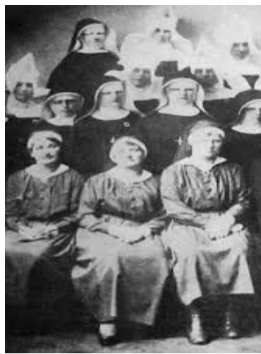
Slika 4. Sestre pomoćnice s pokrivalima za glavu koja su nalik na pokrivala časnih sestara.

Sestre pomoćnice je naziv za današnje medicinske sestre koji se koristio u Hrvatskoj između dva svjetska rata. Uniforme medicinske sestre pomoćnice nalikuju na uniforme koje inače nose časne sestre. Uniforma se sastojala od pokrivala za glavu i haljine koja je bila stegnuta u struku te svjetlijeg ovratnika. U arhivskim dokumentima nalaze se neke pojedinosti o počecima sestrinskih okupljanja, koje bilježi sestra Lujza Janović. Tu piše da su se sestre 1927. i 1928., na inicijativu sestre Ani Papailiopulos, sastajale kako bi osnovale udruženje sestara koje su diplomirale na zagrebačkoj školi. Navodi se i kako su već tada uspjele preko Higijenskog zavoda ukinuti tamno plavi veo te umjesto toga nositi šešir (Dugač & Horvat 2013).