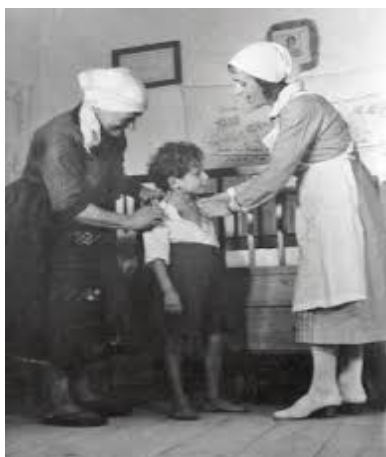
Slika 3. Sestra pomoćnica u kućnom posjetu