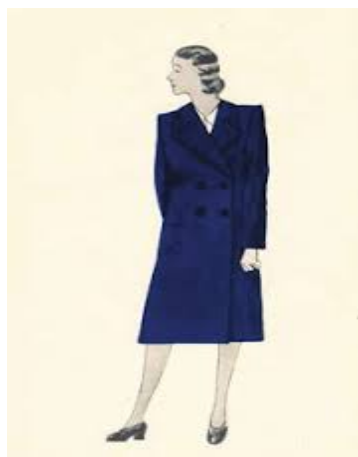
Slika 6. Nacrt haljine za terenski rad, početak 1940-ih (HR-DAZG-237, sign. 35/3)

Sastavni dio uniforme diplomirane sestre bila je i značka koja je sadržavala točno određene simbole i tekst koji je opisivao i potvrđivao status osobe koja je značku nosila (Dugač & Horvat 2013).