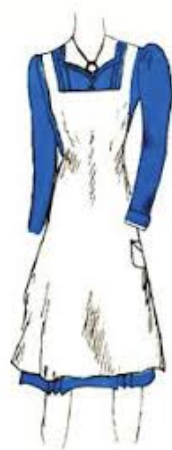
Slika 5. Nacrt haljine za unutarnji rad, početak 1940-ih (Državni arhiv u Zagrebu, HR-DAZG-237, sign. 35/3)