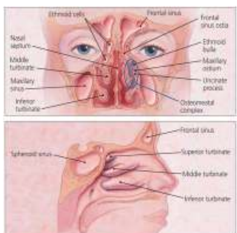
Slika 2. Anatomija paranazalnih sinusa (Fangan 1998)

Sfenoidni sinus je zrakom ispunjena šupljina unutar tijela sfenoidne kosti, varijabilne veličine (O'Rahilly et al. 2008).