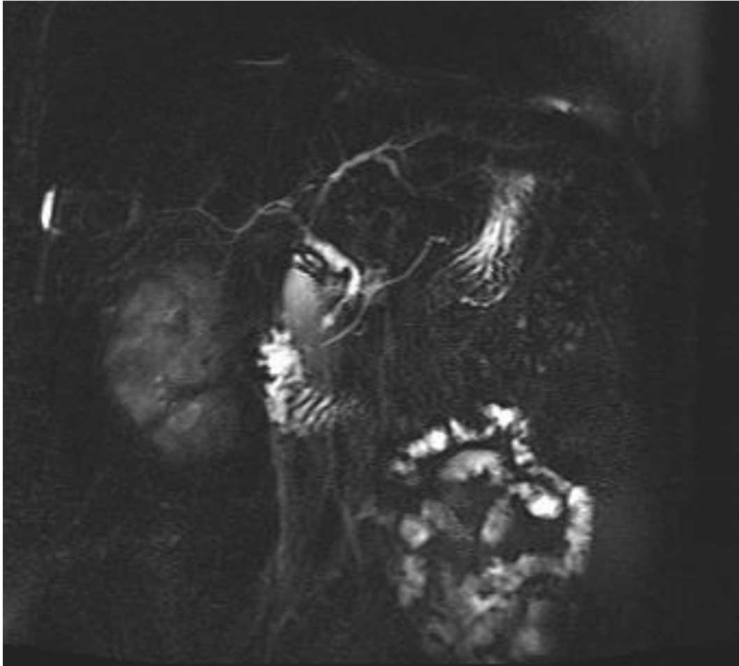
Slika 3. Magnetska kolangiopankreatografija (MRCP)

Glavni žučni vod je nejednolike širine, s krunicastim proširenjima koja se izmjenjuju sa stenozama, od 2 do 6 mm. Unutar jetreni žučni vodovi su nejednolike širine uz pojedina uska stenotična područja naročito u području stjecišta jetrenih vodova, a mjestimično su urednog promjera. Opisane promjene odgovaraju slici primarnog sklerozirajućeg kolangitisa (PSC). Slika iz arhive Kliničkog bolničkog centra „Sestre milosrdnice”.