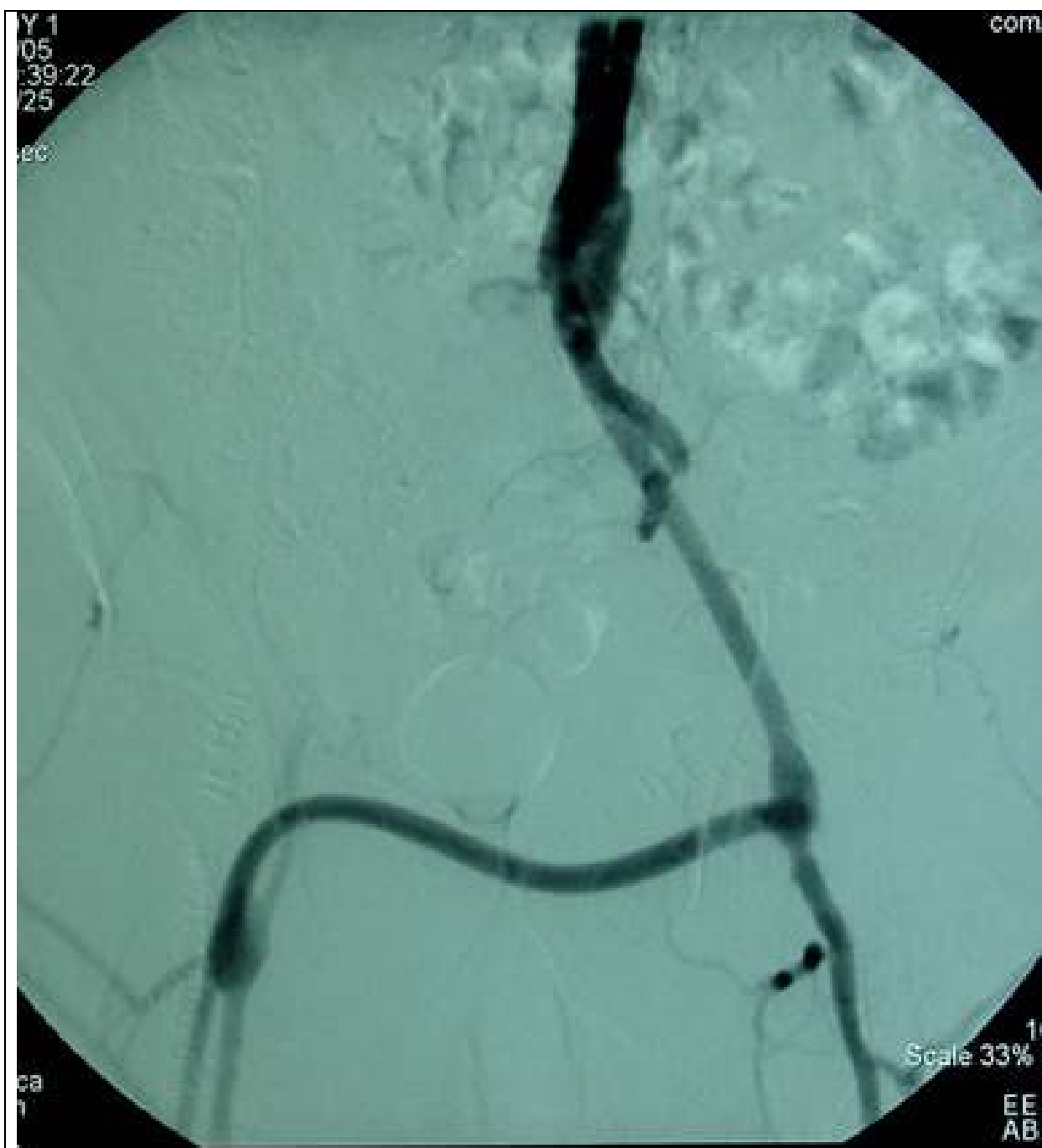
Slika 3 – Rezultat rekonstrukcije provjeren digitalnom suptraksijskom angiografijom.