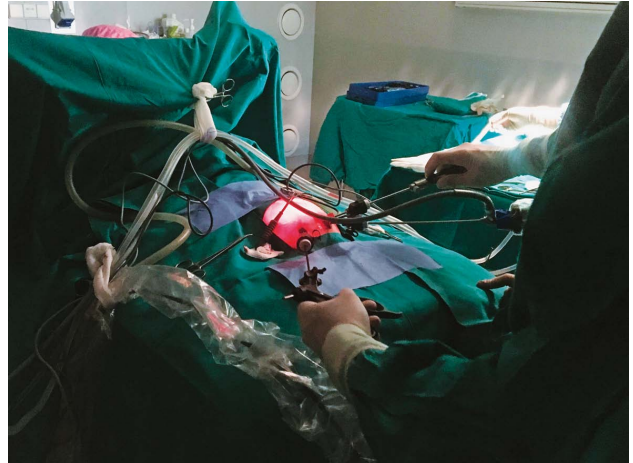
SLIKA 2. POLOŽAJ ABDOMINALNIH TROAKARA FIGURE 2. POSITION OF THE ABDOMINAL TROCARS

Žensko novorođenče je rođeno iz prve trudnoće, a zbog majčine dobi (38 godina) u 16. tjednu trudnoće učinjena je amniocenteza. Kariogram je bio urednog nalaza. Trudnoća je redovito kontrolirana, a zbog položaja zatkom u 38. tjednu gestacije dovršena je elektivnim carskim rezom. Porođajna masa je bila 3140 g, dužina 48 cm i Apgar zbroj jednak u prvoj i petoj minuti života 8/10. Novorođenče je u prvim satima života povratilo rijetki hematinizirani sadržaj bez primjese svježe krvi. Drugog dana života započeto je hranjenje mliječnom formulom. Kratko nakon toga, kroz dan nastavlja povraćati smeđi, potom hematinizirani sadržaj uz primjese majčinog mlijeka. Zbog navedenoga se obustavilo hranjenje, uvedena je nazogastrična sonda i započeta je parenteralna prehrana. Učinjen je ultrazvuk abdomena kojim se prikaže izrazito dilatiran želudac, ispunjen djelomice tekućim gušćim sadržajem, dok se područje piloričnog kanala nije prikazivalo. Pod kliničkom slikom opstrukcije premještena je u neonatološku intenzivnu jedinicu KBC Zagreb. Kod primitka trbuh je bio mekan, aplaniran i bezbolan na palpaciju, ostali status bio je bez osobitosti. Učinjen je babygram , gdje se vidio znak dvostrukog balona s jednim oskudnim tračkom zraka u proksimalnim vijugama tankog crijeva (Slika 1). Nalaz je upućivao na dje-