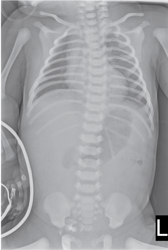
SLIKA 1. BABYGRAM: ZNAK DVOSTRUKOG BALONA FIGURE 1. BABYGRAM: DOUBLE BUBBLE SIGN