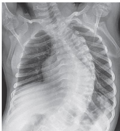
Slika 3. Anteroposteriorni radiogram prsnog koša djeteta sa osteogenesis imperfectom pokazuje izrazitu deformaciju prsne kralježnice Preuzeto iz: Borić & Prpić Vučković (2017), Imaging in osteogenesis imperfecta str. 125., Figure 5., uz odobrenje autora.