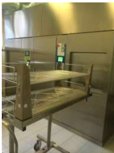
Slika 1- Autoklav

Niti jedna metoda sterilizacije nije savršena. Svakoj se može naći određeni broj nedostataka. Izbor metoda sterilizacije u prvom redu ovisi o vrsti materijala koji se sterilizira i o njegovoj kompatibilnosti sa sterilizacijskim medijem. Da bi se načinio pravilan izbor materijale treba najprije kategorizirati, na one koji su otporni na visoke temperature i na one koje toplina ne oštećuje. Uglavnom, među termostabilnim materijalima neće biti toliko nedoumica, izbor je uvijek sterilizacija parom pod tlakom. Velike su prednosti koje ovu metodu sterilizacije čine najčešće korištenom, a to su: jednostavnost, brzina i ekonomičnost.