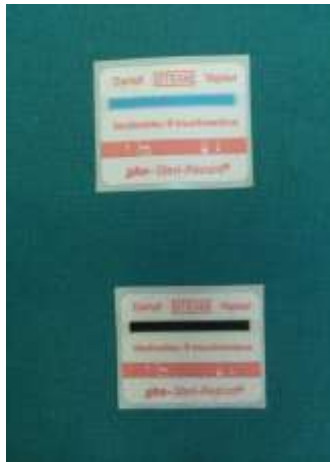
Slika 5-Klasa 1 kemijskih indikatora-naljepnice