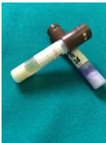
Slika 13-Pozitivna i negativna ampula brzih indikatora

Ako nisu postignuti uvjeti sterilizacije, spore ili samo dio njih preživjet će i razviti se za vrijeme inkubacije u inkubatoru u vegetativne oblike mikroorganizama. Biokemijski procesi koji nastaju tom prilikom bitno mijenjaju pH podloge, zbog čega se mijenja boja indikatora (Slika 13).