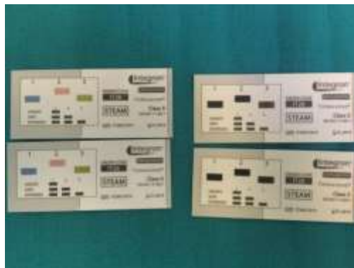
Slika 8-Multiparametarski kemijski indikator

Klasa 4 kemijskih indikatora su multiparametarski indikatori (Slika 8).