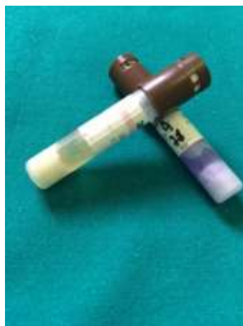
Slika 13-Pozitivna i negativna ampula brzih indikatora

Ako nisu postignuti uvjeti sterilizacije, spore ili samo dio njih preživjet će i razviti se za vrijeme inkubacije u inkubatoru u vegetativne oblike mikroorganizama. Biokemijski procesi koji nastaju tom prilikom bitno mijenjaju pH podloge, zbog čega se mijenja boja indikatora (Slika 13).