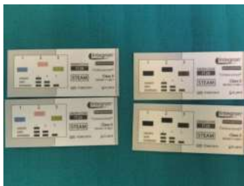
Slika 8-Multiparametarski kemijski indikator

Klasa 4 kemijskih indikatora su multiparametarski indikatori (Slika 8).