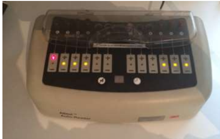
Slika 14-Aparat za očitavanje brzih indikatora

Brzi biološki indikatori su dizajnirani za brzu, dosta pouzdanu kontrolu parne sterilizacije. Obično se koriste zajedno uz aparat za inkubiranje sa čitačem koji konačno očitava rezultate nakon 3 sata (Slika 14). Bitno je da prvi rezultat dobivamo već nakon prvog sata inkubacije što daje dodatnu sigurnost pogotovo ukoliko je rezultat pozitivan (Kelkar U et al. 2004).