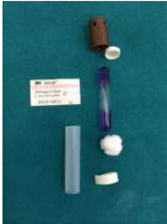
Slika 12-Sadržaj ampule brzog indikatora

Indikator se sastoji od staklene ampule ispunjene hranjivom podlogom ispod koje je papirna traka koja sadrži 10^6 bakterijskih spora. Sve zajedno je smješteno u plastičnu košuljicu koja na poklopcu ima filtarski papir kako bi para mogla prodrijeti do spora (Slika 12).