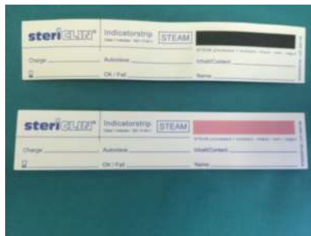
Slika 6- Klasa 1 kemijskih indikatora-kartice

Treba naglasiti da same ljepljive trake sa indikatorom nemaju vrijednost kemijskih indikatora sterilizacije i ne smiju se s njima uspoređivati niti vjerovati u uspješnost postupaka ako su one promijenile boju. Njihova osjetljivost i specifičnost je toliko neznatna da se promjena boje može izazvati i u uvjetima koji su znatno ispod uvjeta potrebnih za sterilizaciju. One se koriste samo kako bi se lako moglo razlikovati je li neki materijal uopće izložen sterilizacijskom mediju, te alarmirati ukoliko je neki paket otvaran (Shintani H 2012) (Slika 4,5,6).