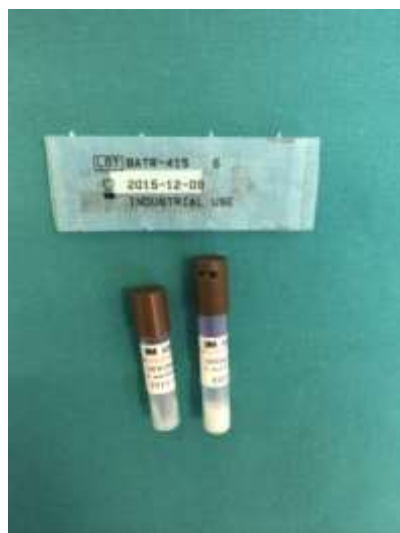
Slika 10-Biološki indikatori

Provodi se uporabom bioloških indikatora koji sadrže posebno pripremljene mikrobiološke spore vrlo visoke otpornosti (Slika 10). U kontrolnom mediju spore su prisutne u mnogo većoj količini nego što su mikroorganizmi prisutni na materijalu pripremljenom za sterilizaciju. Smatra se da ukoliko su spore uništene i onesposobljene za život niti jedan potencijalni patogen nije mogao preživjeti sterilizacijski proces. Biološki indikatori rezultate praćenja parametara i procesa sterilizacije integriraju u jednom pokazatelju, a to je smrt mikroorganizama.