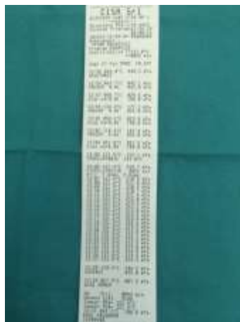
Slika 2-Ispis fizikalnih parametara sterilizacije

Kroz čitav proces sterilizacije navedeni parametri se kontroliraju putem kompjuterskog sustava te se njihove vrijednosti ispisuju putem štampača sterilizatora. Ispis se čuva kroz najmanje 7-10 godina kao trajni dokaz o uspješnosti pojedinog ciklusa sterilizacije (Slika 2 i 3).