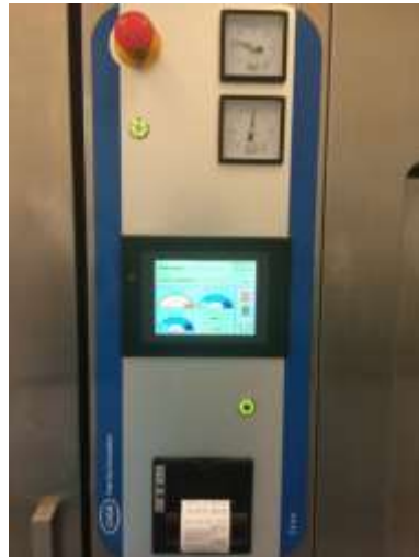
Slika 3-Fizikalni nadzor

Ipak fizikalni monitoring je nužan jer svako odstupanje od normale trenutno upozorava na grešku u odvijanju procesa. Zajedno sa kemijskim i biološkim indikatorima nam daje cjelovit uvid u uspješnost sterilizacije