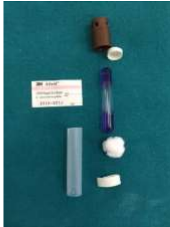
Slika 12-Sadržaj ampule brzog indikatora

Indikator se sastoji od staklene ampule ispunjene hranjivom podlogom ispod koje je papirna traka koja sadrži 10^6 bakterijskih spora. Sve zajedno je smješteno u plastičnu košuljicu koja na poklopcu ima filtarski papir kako bi para mogla prodrijeti do spora (Slika 12).