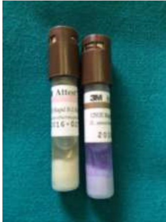
Slika 1511-Pozitivna i negativna ampula brzog indikatora

Čitanje rezultata nakon 3 sata omogućuje nam da kratko zadržimo materijal koji je bio izložen procesu sterilizacije dok ne dobijemo potvrdu o ispravnosti ciklusa. Zbog toga se sve više koriste.