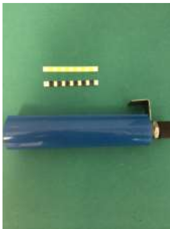
Slika 7-Bowie&Dick simulacijski test

neželjenog zraka u komori sterilizatora i upozoriti na slabost u sustavu. Obavezno se provodi svakodnevno, u praznoj komori prije početka rada u sterilizaciji. Program sterilizatora predviđen za Bowie&Dick test izrađen je tako da se sav uhvaćeni zrak u komori usmjeri na jedno mjesto, ispitni paket. Promjena intenziteta boje ili izostanak promjene boje Bowie&Dick indikatora u paketu dokazuje prisutnost zraka, odnosno neispravnost sterilizatora. Ovaj test uveden je u praksu 1963. godine kao rutinski test za provjeru vakumskog sistema predvakumskih sterilizatora (Darmady EM et al. 1964; Kelsey JC et al. 1963; Fallon RJ 1961) (Slika 7).