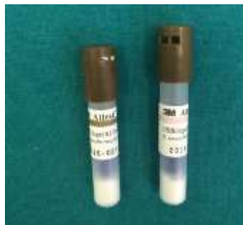
Slika 11-Brzi biološki indikatori

To su zapravo screening-testovi. Očitavanje se zasniva na promjeni boje hranjive podloge izazvane biokemijskim procesima i promjenom pH podloge koji nastaju tijekom pretvorbe sporogenih u vegetativne oblike mikroorganizama.