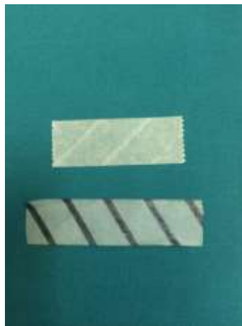
Slika 4-Klasa 1 kemijskih indikatora- ljepljiva traka

Klasa 1 kemijskog indikatora su obično ljepljive trake ili kartice koje vizualno daju kontrolu je li neki predmet bio izložen sterilizacijskom ciklusu. Promijenjena boja indikatora ukazuje da je paket bio u kontaktu sa sterilizacijskim medijem, u ovom slučaju sa vrućom vodenom parom.