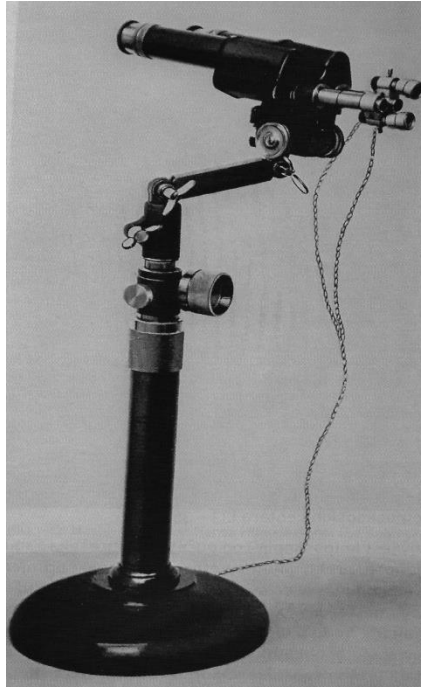
Slika 3. Prvi kolposkop Hansa Hinselmann.

Pauza od 3 godine od pročelnništva u Altoni i umirovljenja otkriva i njegovu tamnu stranu. Naime, Hinselmann je za to vrijeme služio zatvorsku kaznu za zločine u kojima je sudjelovao u vrijeme Drugog svjetskog rata. Od 1935.g. rasni su zakoni u Nuernbergu natjerali pripadnice romske nacionalnosti na tragičan izbor: biti poslone u koncentracijski logor ili biti sterilizirane. Kirurški postupci sterilizacije žena bili su obavljani od strane asistenata pod nadzorom Hinselmann te je optužen za sterilizaciju šestoro žena romske nacionalnosti. Hinselmann je također nadzirao i podupirao kolposkopske eksperimente obavljane u Auschwitzu od strane zloglasnog dr. Eduarda Wirthsa. U tim su se istraživanjima o preinvazivnim lezijama odstranjivao vrat maternice žena čak i na najmanju sumnju abnormalnosti, često bez anestezije. Takvi su postupci u nehigijenskim i teškim uvjetima koncentracijskog logora nerijetko rezultirali infekcijama i krvarenjima koja su završila smrću ili oslabljenošću pacijentice zbog čega bi bila poslana u plinsku komoru. Za te postupke Hinselmann nije kazneno proganjan.