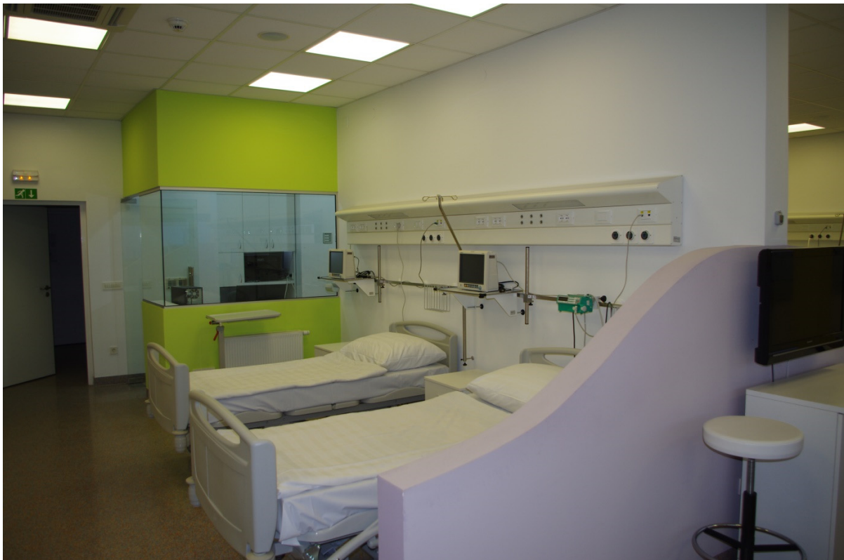
Slika 1. Odjel za klinička ispitivanja, Dječja bolnica Srebrnjak, Zagreb

aspekt, informirani pristanak te daje svoje mišljenje Ministarstvu koje donosi konačnu odluku o odobrenju. Tek s odobrenjem ministra istraživanje se može početi provoditi u onim centrima za koje je dobiveno takvo odobrenje. Godišnje se u Hrvatskoj odobri između 80-90 kliničkih ispitivanja. Prema informacijama dostupnim na službenim mrežnim stranicama Svjetske zdravstvene organizacije u Republici Hrvatskoj se godišnje provodi tek 1% od ukupnog broja kliničkih ispitivanja u Europi. U drugim zemljama Europske Unije taj postotak je znatno viši, primjerice u Danskoj 7,5%, Belgiji 8,9 %, Mađarskoj 5.2%. Trenutno se u Hrvatskoj provodi 1049 kliničkih ispitivanja (12).