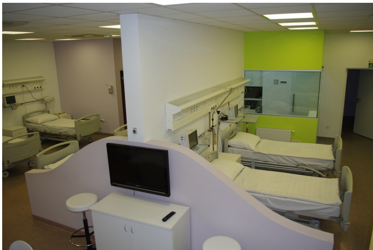
Slika 2. Odjel za klinička ispitivanja, Dječja bolnica Srebrnjak, Zagreb

u tom području radi najviše istraživanja, i stoga su napravljeni veliki pomaci u liječenju teških i nekad neizlječivih bolesti.