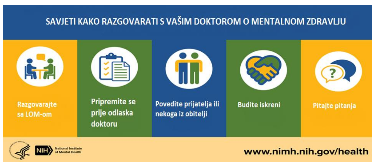
Slika 1. Savjeti kako razgovarati s vašim doktorom o mentalnom zdravlju. Prema: National Institutes of Health (14).

Kakva je uloga SOM-a? U navedenim situacijama dolazi do izražaja jedinstveni središnji položaj SOM-a unutar zdravstvenog sustava, njegova sposobnost vođenja kroničnoga i zahtjevnoga pacijenta, ali i njegova uloga kao čuvara ulaza (engl. gatekeeper ) u zdravstveni sustav te liječnika prvoga kontakta sa oboljelim kao što vidimo na Slici 1.