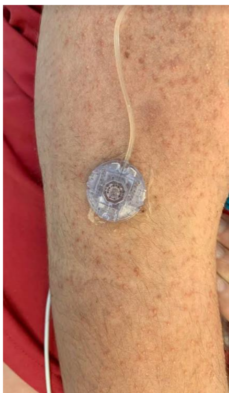
Slika 6. Prikaz ekstremiteta sa lokalnom reakcijom na trepostinil