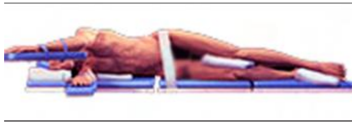
Slika 3. Lateralni ležeći položaj

[http://www.specijalna-bolnica-aksis.hr/procedure-operacije/prednja-vratna-discektomija-i-fuzija-acdf/]