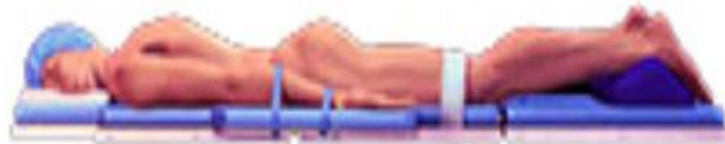
Slika 4. Pronacijski položaj

[http://wiki.med.uottawa.ca/download/attachments/7438480/PositioningBooklet.pdf?...1...]