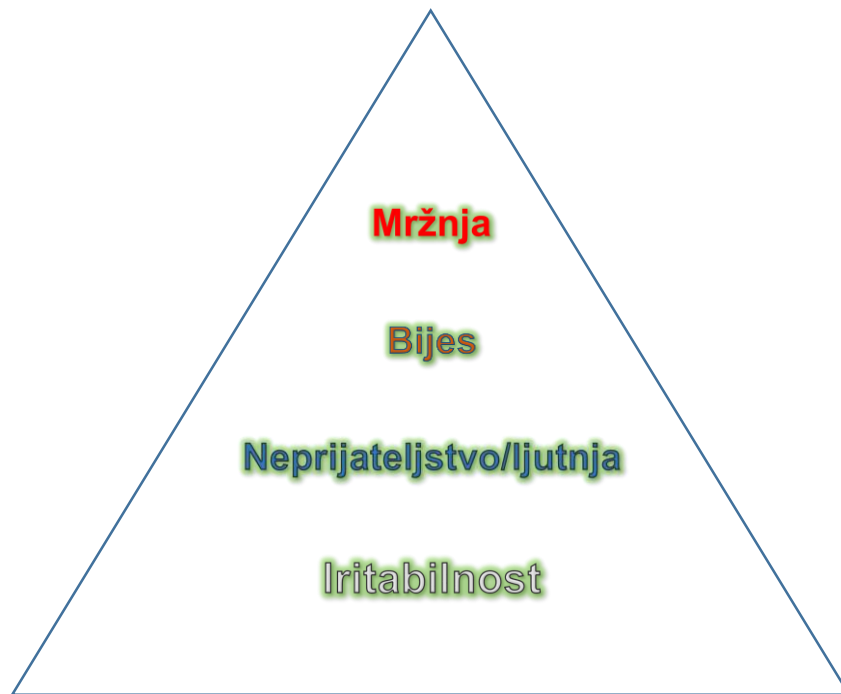
Shema 3. Gradacijski prikaz agresivnog afekta, prilagođeno prema Kernbergu.

Prema Akhtaru bijes je reakcija na frustraciju, akutan je, pokušava odvojiti ego od objekta. Mržnja je kao što je Rosa spomenuo defenzivni mehanizam, kronična je, veže subjekt uz prijeteći idealizirani objekt, fokusirana je na prošlost i budućnost, i kao takva postaje patološka. Lazar želi objasniti kako je mržnja borba protiv samopasivnosti, pojednostavljenje i odvajanje od života kao jedine opcije. (8) Bollas smatra da mržnja ne mora uvijek biti u borbi s ljubavlju, ona može biti jedini način na koji subjekt može imati intenzivno afektivan odnos s objektom. (8) Visoka razina mržnje javlja se i u niz kliničkih sindroma. Primjerice u narcističkom poremećaju ličnosti s osnovom u patološkoj zavisti