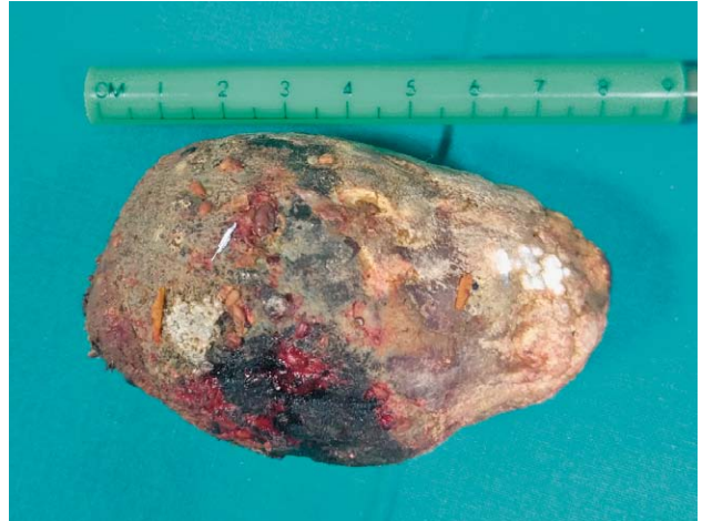
SLIKA 3. ŽUČNI KONKREMENT DULJINE 9 CM

ukupni bilirubin (6 \mu\text{mol/L} ), CRP (190.5 mg/L), u urinu Leu (3+), nitriti (1+), ketoni (2+), urobilinogen (3+). Učinjeni RTG srca i pluća bez osobitosti. Nativni CT abdomena i zdjelice prikaže pneumobiliju i opstrukciju sigmoidnog kolona intraluminalno smještenim konkrementom promjera 4,8 cm (slika 1). Nalaz