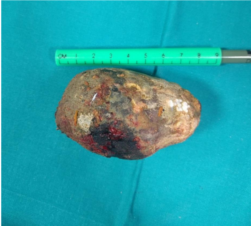
SLIKA 3. Žučni konkrement duljine 9 cm. Prema: Augustin i sur., Gallstone ileus sigmoidnog kolona: prikaz slučaja, 2021. Uz dopuštenje Liječničkog vjesnika