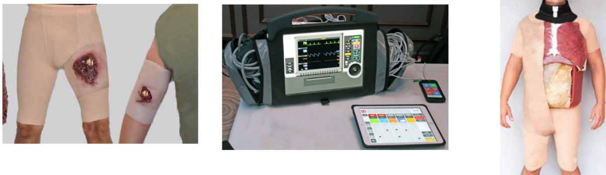
Slika 3: Hibridni simulatori koji se integriraju na postojeći model ili čovjeka