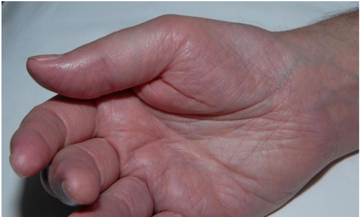
Slika 2 Slika koja prikazuje umjerenu tenarnu atrofiju desne ruke kod muškarca s bilateralnim sindromom karpalnog kanala. Prema: Aroori S, Spence RA. Carpal tunnel syndrome. The Ulster Medical Journal. 2008 Jan;77(1):6-17.

mjeri zahva eni gubitkom osjeta zbog odvajanja ramus palmaris nervi mediani prije njegovog ulaska u karpalni tunel. [12] [13] [14]