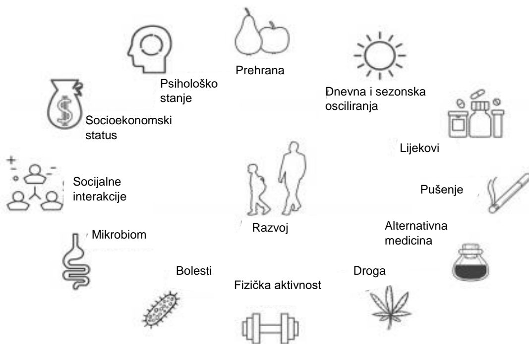
Slika 2. Potencijalni faktori i čimbenici zabune (engl. confounders ) koji utječu na epigenetske profile (Hübel i sur., 2019).

karakterizirani dugotrajnom stabilnošću (Roadmap Epigenomics Consortium i sur., 2015). Iako je povijesno definirano da se događa neovisno o sekvenci DNA, nedavni je rad pružio dokaze o raširenim učincima genetskih varijanti na epigenetska stanja. Posebno se sve više istražuju lokusi kvantitativnih svojstava metilacije (mQTL): polimorfizmi pojedinačnog nukleotida (SNP) koji utječu na stanje metilacije CpG otoka, obično u neposrednoj blizini SNP-a (Gibbs i sur., 2010; McClay i sur., 2015). Za razliku od slijeda genoma, epigenetske su promjene dinamične i mogu se razlikovati u zavisnosti od tipa stanica i tkiva, starosti i razvoja, a mogu biti podložne okolišnim čimbenicima uključujući lijekove i stres (slika 2).