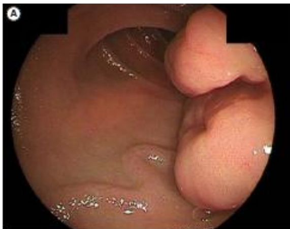
Slika 3. Prikaz GIST-a pomoću endoskopije dvostrukim balonom (DBE), multinodularni submukozni tumor s proširenim zavijenim krvnim žilama

Prema: Ihara Y, Torisu T, Moriyama T, Umeno J, Hirano A, Okamoto Y. i sur. (2019.)