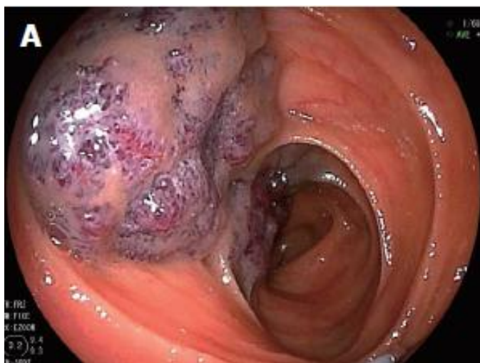
Slika 2. Prikaz hemangioma transanalnom endoskopijom dvostrukim balonom

Za dijagnozu gastrointestinalnog krvarenja prva pretraga koja se koristi je endoskopija gornjeg i donjeg dijela gastrointestinalnog trakta. Nakon urednog endoskopskog nalaza izvodi se endoskopija videokapsulom (VCE) i enteroskopija dvostrukim balonom (DBE) (12). Enteroskopija dvostrukim balonom ima prednost zbog mogućnosti biopsije te terapijskih metoda kao što su elektrokoagulacija i hemostaza klipsanjem. Kod preoperativne enteroskopije može se primijeniti indocijanid zelena i Indija boja za „tetoviranje“ hemangioma koje će omogućiti lakšu detekciju promjene. U dijagnostici se također koriste CT, MR, angiografija i scintigrafija (13).