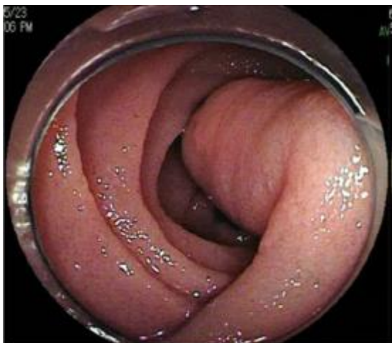
Slika 4. Endoskopija dvostrukim balonom prikazuje cilindrični submukozni tumor u gornjem jejunumu

Prema: Yatagai N, Ueyama H, Shibuya T, Haga K, Takahashi M, Nomura O. i sur. (2016.)