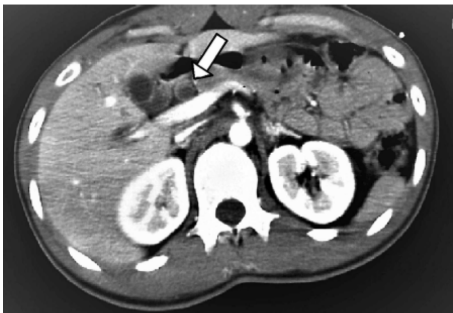
Slika 1. Dilatacija glavnog žučnog voda na CT-u kod pacijenta s tubuloviloznim adenomom duodenuma

u stijenci duodenuma uz induraciju i rigidnost papile ili ulceraciju tvorbe. Metoda endoskopske ultrasonografije može ponekada otkriti invazivni karcinom koji nismo dijagnosticirali s prethodnim metodama i ima veće značenje u preoperativnom stagingu karcinoma (9). Za dijagnozu tumora u udaljenijim dijelovima tankog crijeva koriste se enterokliza i endoskopija kapsulom (8).