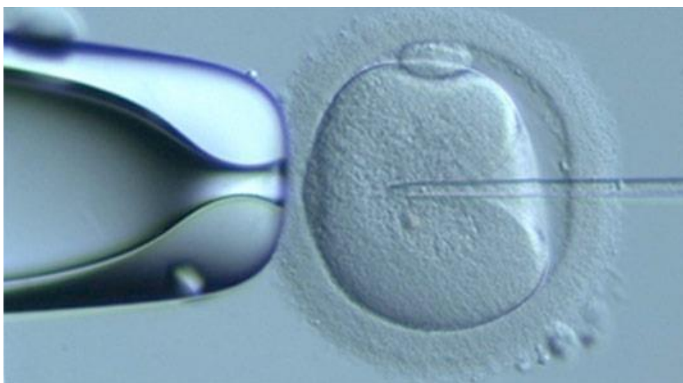
Slika 2. Intracitoplazmatska injekcija spermija (ICSI) (20)

IMSI (intracytoplasmic morphologically selected sperm injection) kojom se ocjenjuju pojedini dijelovi spermija pomoću invertnog mikroskopa pri povećanju od 6000 puta. Primjene ovih metoda za selekciju spermija rezultiraju većim brojem uspješnih trudnoća i manjim brojem kromosomskih abnormalnosti (3,4,19).