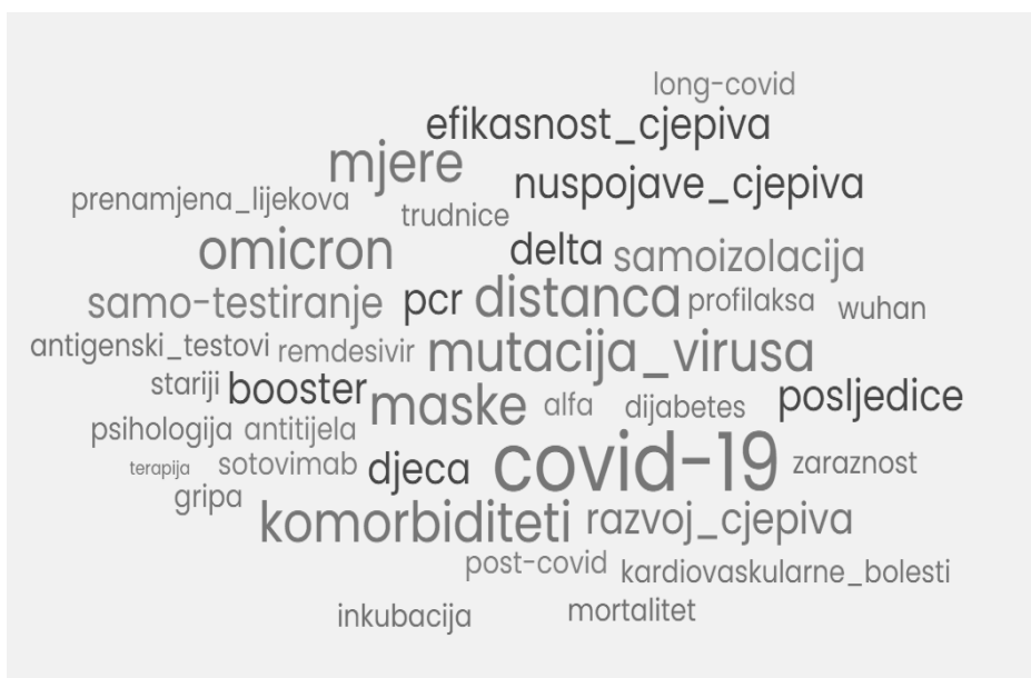
Slika 3. Grafički prikaz najčešćih tema probira literature za potrebe Ministarstva zdravlja

U prosincu 2021. godine suradnja knjižničara iz SMK-a s Ministarstvom zdravlja formalizirana je. Osnovana je Radna skupina za praćenje i obradu stručnih i znanstvenih radova vezanih uz epidemiju bolesti COVID-19. Voditeljica osmeročlane radne skupine istaknuta je profesorica zagrebačkog Medicinskog fakulteta, ravnateljica Škole narodnog zdravlja „Andrija Štampar“, koordinatorica je savjetnica ministra zdravlja, a članovi voditelj i djelatnici Hrvatskog zavoda za javno zdravlje te tri knjižničarke s Medicinskog fakulteta Sveučilišta u Zagrebu (dvije su autorice ovog teksta, a treća voditeljica knjižnice ŠNZ „Andrija Štampar“). Tijekom tjednih virtualnih sastanaka dogovaraju se zadaci prema kojima knjižničarke jednom tjedno isporučuju tražene informacije. Područje interesa radne skupine mijenja se s obzirom na tijek pandemije. Zastupljenost pojedinih tema grafički je prikazana na slici 3. Osim klasičnog pretraživanja odabranih specijaliziranih baza podataka, časopisa i mrežnih stranica, knjižničarke rade i detaljan probir među pronađenim informacijama, utvrđujući one najznačajnije koje donose nove informacije i imaju visoku dokaznu snagu.